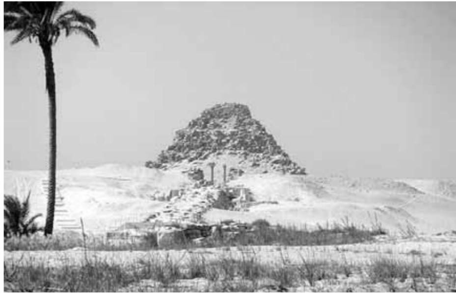
هرم ساخورع بابوصير