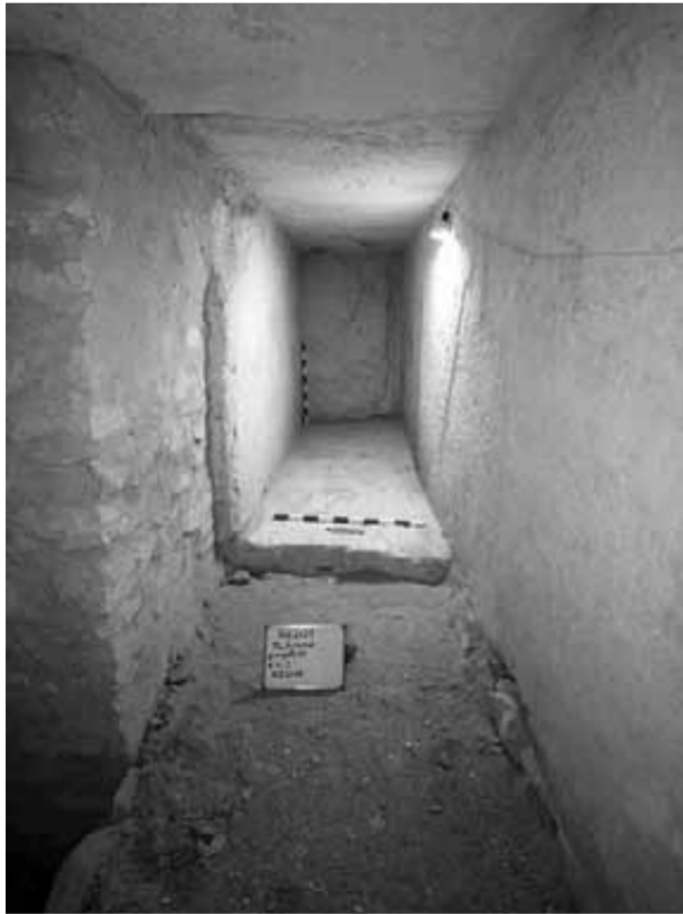
أحد المخازن المكتشفة