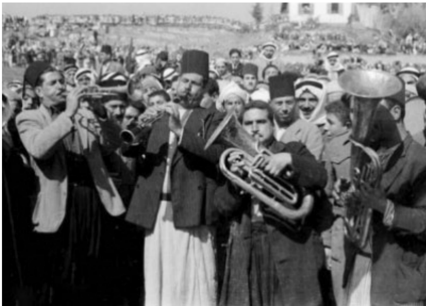
فرق موسيقية احتفالاً بعيد الفطر