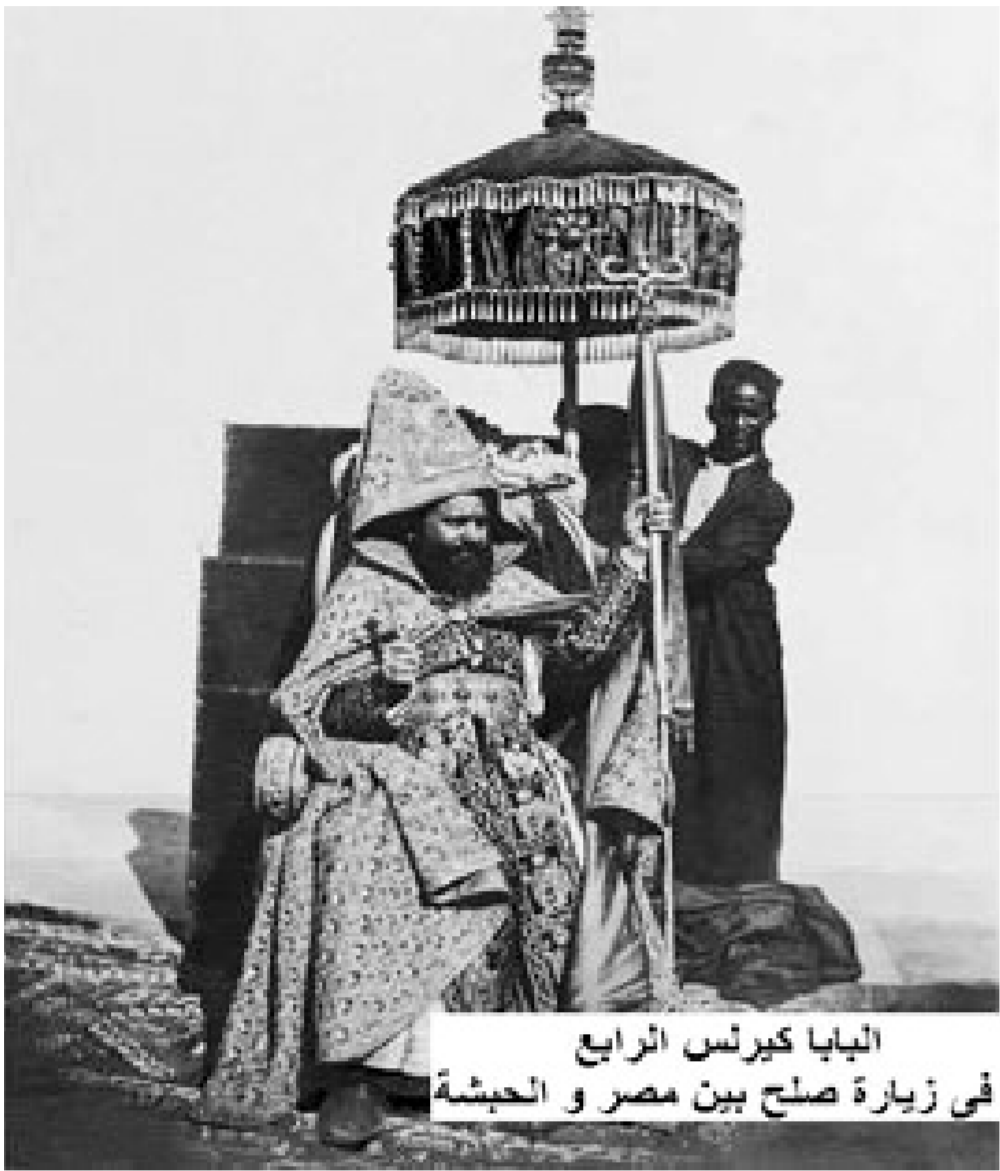
الباپا كيرلس الرابع في زيارة صلح بين مصر و الحبشة

الخديوي، وفعلا تم شراء المطبعة، ووصلت مينا بلاق عام ١٨٦٠ وكان يومها «الباپا» في دير الأنبا أنطونيوس بالصحراء الشرقية، فكتب إلى وكيل البطريكية بالقاهرة بأن يستقبلها في زيه الكهنوتي ويكون الشماسه ملباسهم الكهنوتي، وهم يرعدون الخان الفرخ والسور، ولبا عابه البعض على ذلك بعد مجيئه من البرية، أجابهم لو كنت حاضرا فور وصولها لرقصت أمامها كما رقص داود النبي أمام تابوت العهد، وتعتبر هذه المطبعة هي الثانية في مصر بعد المطبعة الأميرية التي اشترها محمد علي أيام حكمه.