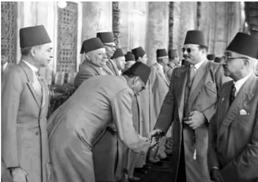
الملك فاروق يستقبل المهنتين بعيد الفطر

تعتبر هذه العروض الموسيقية جزءًا لا يتجزأ من تقاليد الاحتفال بعيد الفطر في خلال عهد حكم أسرة محمد على، حيث كانت تقام احتفالات شعبية في الشوارع والأسواق تتضمن عروضًا موسيقية وفنية والألعاب التقليدية في المناسبات الرسمية والشعبية خلال الاحتفالات بعيد الفطر.