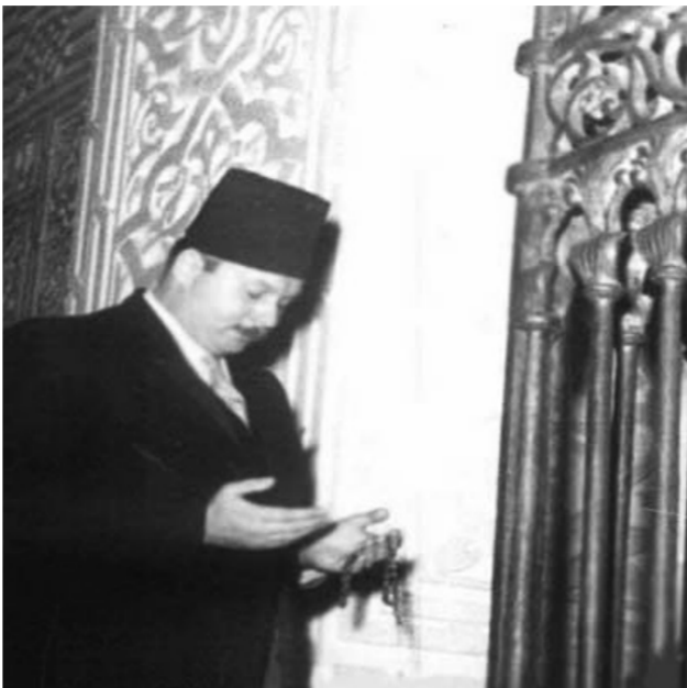
أمم صريح جده محمد على باشا