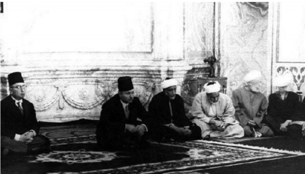
أثناء تادية صلاة العيد

وفي فترة الثلاثينات وصفه حافظ محمود في كتابه القاهرة بين جليلين، بقوله الاستعداد لعيد الفطر حيث قال: «كانت رائحة العيد تفرح في جو القاهرة منذ بداية الأسبوع الأخير من شهر رمضان، لأنها راحة الكلك والظلم التي كان مجتمع ما قبل سنة ١٩٢٩، حيث تشهد أرجاء القاهرة زحام النساء اللواتي يحملن الصابجات لتستويه الكلك في الأفران، وفي الواقع أن البيوت القديمة كانت تسامًا فاخر حين كان الكلك فيها لكثرة قد بقي في البيوت من العيد للعيد، ولكن مع اندلاع الحرب العالمية الثانية والأزمة الاقتصادية العالمية تقلص خبز الكلك في المنازل، كان من الصعب تنظيم المسيرة من البيوت إلى الخنازير لحمل الكلك، وقد أدى هذا النقص إلى توزيع صناعة الكلك في محلات الكلك، وكان حي الموسكى يبع المراكب الدائبة والأحجام لقياس اللبل للأطفال والفتيات اللوات، وبمرة أخرى يقوم العامة من جديد بعملية قياس عند بائع الأبيحة، أما تجارة الطرايش فكان من نصيب البائع المتجول، وكان سعر الطرايش الأحمر الصغير يبدأ من خمسة قروش.