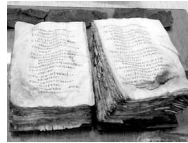
Le manuscrit avant la restauration