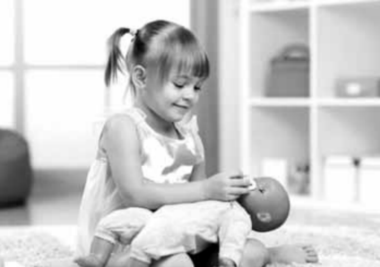
العروسة أهم لعبة لهوية البنات