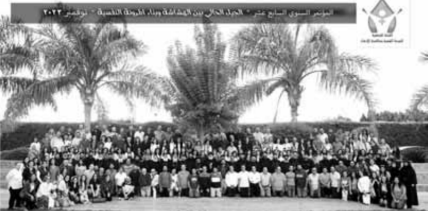
المؤتمر الثانوى ١٧٨ للصحة النفسية والهوية الجنسية ومكافحة الامان

«الهوية الجنسية»، مصطلح يتردد على مسامعنا كثيراً في الآونة الأخيرة، ويقول الخبراء والمهتمون إن عرس هوية جنسية سوية في أطفالنا بعد حائط الصد وصمام الأمان ضد الاضطرابات النفسية والوقاية من المثلثة الجنسية التي تطل برأسها على العالم وتنافي خطة الله في خلق البشر. وانتهت الكنيسة القبطية الأرثوذكسية لهذا الخطر، فأسست لجنة جمعية برأسها قدايسة البابا تواضروس الثانى ومقرها نيافة الحبر الجليل الأنبا ميخائيل الأسقف العام لقطاع كنائس حدائق القبة والوابلى والعباسية تهتم بالصحة النفسية لأبنائنا وبغرس وتنمية هوية جنسية سليمة. التقت «وطني» مع قدس أبونا القس موسى فهمى سكرتير اللجنة الجمعية للصحة النفسية، وكن هذا الحوار.