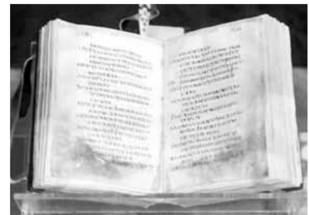
Le manuscrit après la restauration

Le Ministre a commencé l'événement par une visite du hall destiné à l'exposition du manuscrit du Livre des Psaumes, au cours de laquelle il s'est prêté à une explication détaillée de l'histoire du manuscrit, ses pages, des documents qui le composent et le projet de restauration et de documentation qui a duré près de cinq ans, par le biais d'une équipe de restaurateurs égyptiens du Musée copte et du Musée d'art islamique, sachant qu'il s'agit du plus ancien Livre complet de Psaumes coptes jamais écrit.