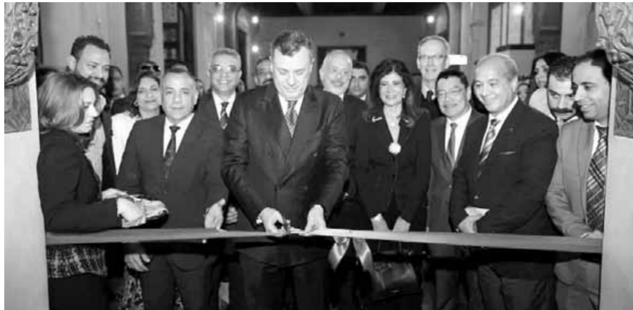
Le ministre du tourisme inaugurant le hall du Livre des Psaumes

Lors d'une grande célébration au Musée copte du Vieux Caire, le ministre du Tourisme, Ahmed Issa, accompagné du Dr Moustafa Waziri, secrétaire général du Conseil suprême des antiquités, a inauguré le hall du manuscrit du Livre des Psaumes après avoir terminé sa restauration et sa documentation.