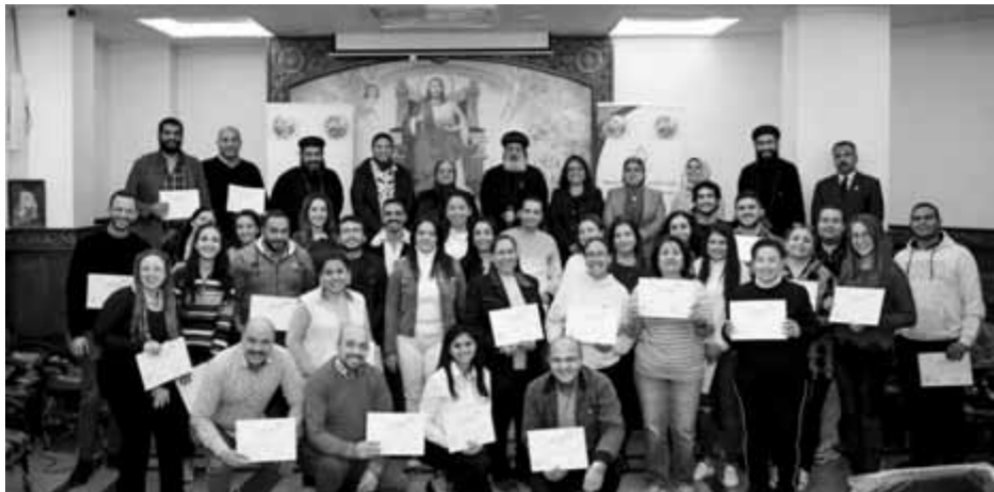
ختام التدريب للصحة النفسية لخدام مدارس الأحد بحضور الأنبا ميخائيل

الغياب الجسد أو معنوياً، أو القسوة، ستترجم كل هذا كرفض لأوثنا. أنت تعلمه كيف تتعامل مع الصبيان والرجال. ستتعلم كيف يجب أن تعامل النساء بمراقبة علاقتك أنت مع زوجتك. قدم صورة جيدة عن الزواج، لتتبنى زوجاً مثلاً أيبها ● ما هي العلامات الإذارية في سلوك البنات والتي تحتاج إلى تدخل؟ ● إذا التفت الوالدان لإشارات لدى بنتهما مبكراً جداً، بمقدورهما أن يغيروا مسار حياتها قبل أن يترسخ لديها عندما تكبر. وكما أشترنا مهم تفهمن أن وارد يحصل نقطة أو اثنين منهم بشكل عرسي أثناء النمو ده مش بيقفلنا، لكن التكرار أكثر من نقطة لفترة بيوتها يحتاج منا تدخل مبكر أننا نفعل كل النقط السابقة إلى اتكناها فيها ومن هذه الإذارات: رفضت الابنة أن تتبول جالسة وأصررت على الوقوف اثنا، تقول أنه سيظهر لها أعضاء جنسية كوروية، لا تريد أن يكر شياها أو الة الدورة الشهرية، ترفض تماماً أن تكر وتتزوج وتنجب، ترفض كل شي، أنتوى الاسم، الاسم، المايكس، وهناك قنوات التواصل مع اللجنة الجمعية للصحة النفسية من خلال الأرقام: ٠١٠٧٤٩٠٧٧٤٩ ٠١٢٧٥٧١١٢٢