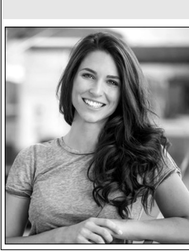
نشر بتاريخ: ١٨/٦/١٩٧٨

فى القصور.. جمال يرغم المرء على الإطراق.. كانت بشرتها فى صفا المرمر.. لها جاذبية لا تقاوم.. جاذبية تأسر الروح وتجعل نبضات القلب تتلاحق فى الصدر.. ويدت لى أنها أجمل من رأيت.. الكرامة... - الكرامة هى أمن وأعلى ما يملكه الإنسان!.. كلام... - كلام الإنسان برهان أصله.. وترجمان عقله.. وبيان فضله!.. يقول... - يقول تولىستوى.. «الحياة حب.. والحياة فكر.. والحياة عمل».. وإبتكار وإنتاج.. - «الحب إذا سكت هلك.. والعارف إذا سكت ملك».. ما أجلي... - ما أجلي قصة رجل وامرأة عرفا معنى الحب، وعرفا معنى الحياة..