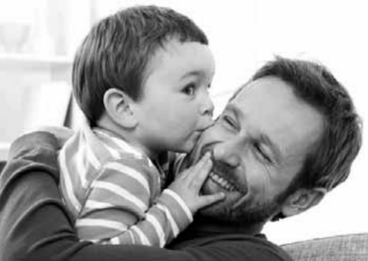
الحضن الأبوى حضن حنان

معروف أن الطفل لديه «خزان حب» نسبية ٥٠٪ لصالح الآب و ٥٠٪ لصالح الأم، وكل منهما مسئول عن ملء ذلك الخزان، فإذا ما افتقد الابن مثلاً نسبة الـ ٥٠٪ الخاصة بالآب نتيجة للإهمال أو القسوة هنا يصبح فريسة سهلة للإرتواء، في ميول واحرفات مثلية والبحث عن تعويض نسبة الذكورة فيما هم من نفس جنسه. كذلك الحال إذا ما اعتقدت الابنة نسبة الـ ٥٠٪ الخاصة باهتمام الأم وجها وقبولها تكون النتيجة هي البحث خارج إطار العائلة عن تعويض ذلك الفراغ بعلاقات خاطئة من نفس جنسها نتيجة لتبعية للعوامل البيئية التي شوهت لها إدراكها بهويتها الجنسية. تشير دكتورة عادل إلى مراعاة نوعية الألعاب الخاصة بالولد حيث الحركة واللباقة البدنية من جرى ولعب وتنشط بخلاف الفتاة لتلعب بالعراس وادوات الطبخ وخاصة في السنن الأولى للتأكيد على هوية كمال من الولد والبتل جنسياً لأن الخلط بين نوعي الألعاب أو تبديل الأدوار يحثه أن طفل يمكنه إحداث اضطراب في الهوية. كذلك الاعتصام مثلاً بالألوان المناسبة لكل من الولد والبتل بما يؤكد هي هوية الجنسية. ثابتت ملابسها تكون روزاً أو فوشيا وغيرها في المقابل اختيار الألوان المناسبة إلا أنها مهمة جداً في فالأمور التي ربما يراها البعض بسيطة بما يؤثر على تطور هويته. كل ذلك كاف لإحداث الاضطراب ويحتاج لوعي حماية لأبنائنا.