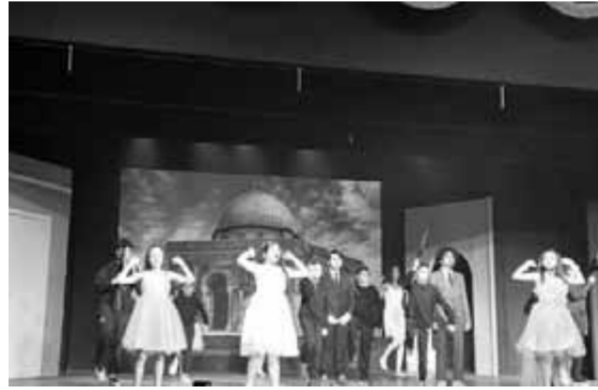
فريق العمل الاستعراضى أثناء أغنية «زهرة المدائن»