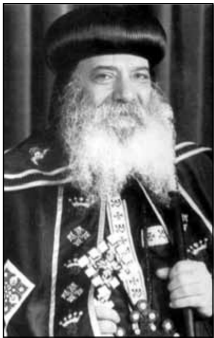
بقلم مثالث الرحامات طيب الذكر المتبحر: