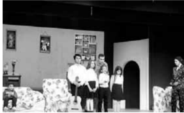
أسرة «عائلة ونيس» الطلابية أثناء طابور الصباح