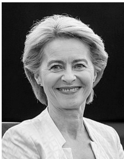
رئيسة المفوضية الأوروبية أورسولا فون ديرلاين

هناك تطبيقات متعددة للذكاء الاصطناعي تقيد البشرية كثيراً، على سبيل المثال وليس الحصر هناك برامج تكنولوجية تتعلق بتغير المناخ، وهي تسهل تكيف صغار المزارعين مع الظروف المناخية المتغيرة، وتدمع الحكومات في تشكيل سياسات فعالة، ينطوي ذلك على الاستفادة من