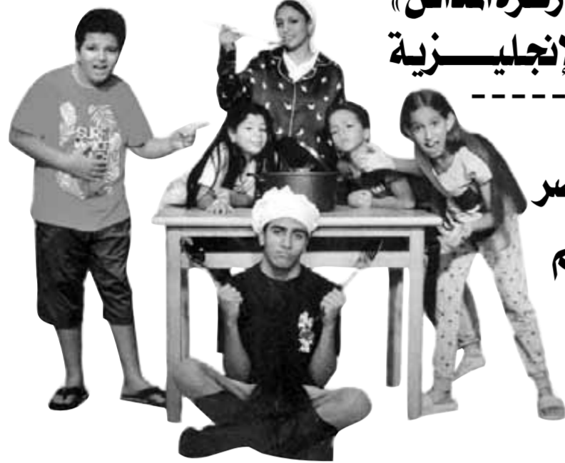
أفئش مسرحية «عائلة ونيس» في تجربتها الطلابية

من خلال الفن لأن الفن هو تنوير للتعليم لأنه من الممكن أن يصنع الفنان تعليماً ومن هنا يأتي دور الفن في المجتمع. وتابع: أتمنى أن يتم تعميم هذه التجربة بجميع المدارس، وأن تقدم من خلالها جميع أعمالنا المسرحية الخالدة مثل مسرحيات نجيب الريحاني وعلي الكسار، وهذا يعد فرصة رائعة للجيل الحديث أن تشاهد وتتعرف على تراثنا الفني الذي طالما شكل هويتنا المصرية ذلك لأن هؤلاء الأطفال هم من سيقودون الأمة في المستقبل.