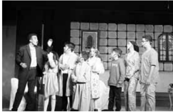
فريق العمل التمثيلي في أحد مشاهد العرض