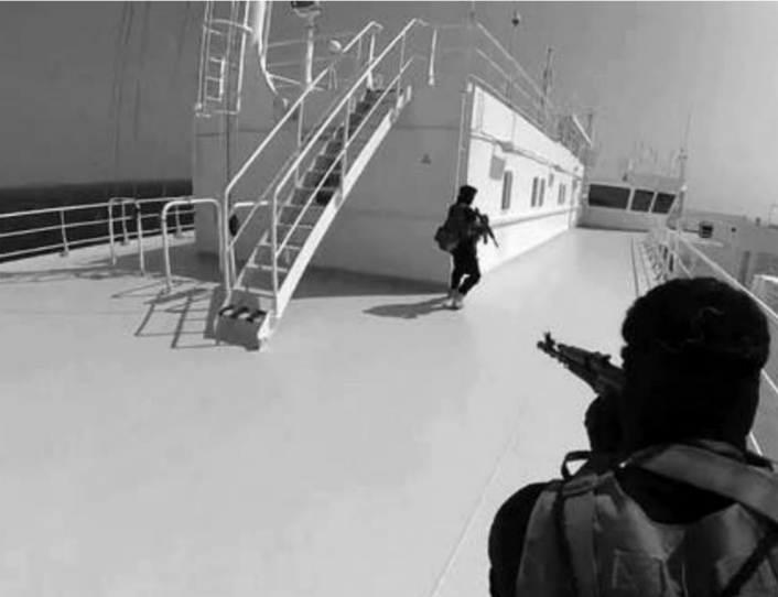
الهجمات على السفن فى البحر الأحمر

تدعو الأسرة الأهل والأحباب لحضور صلاة القديس الإنهى لروحيهما الغاليين فى السادسة صباح الاثنين ١٩ فبراير ٢٠٢٤ بكاتدرائية زيس الملائكة - مسبخانيل بأسيوط تلغرافياً: أسرة فيليب النحال - أسيوط