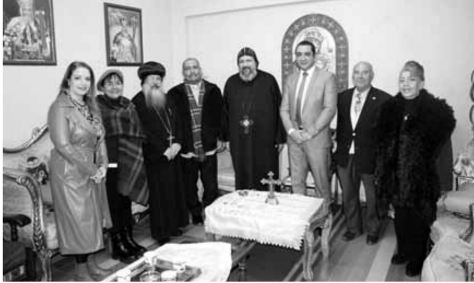
جانب من الضيوف ومحرة «وطني»