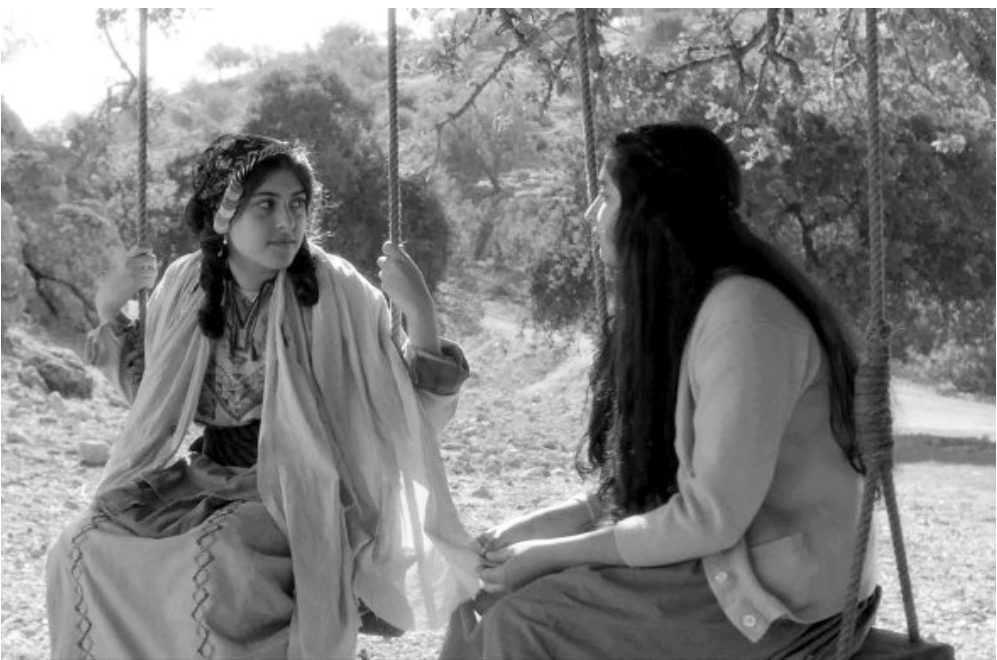
مشهد يجمع فرحة بصديقتها يتبادلان الحديث والضحكات

الولادة وبالفعل بمجرد دخولهم المنزل وضعت الأم حملها فكان طفلاً رضيعاً هو فقط من نجا من رصاص الصهاينة.