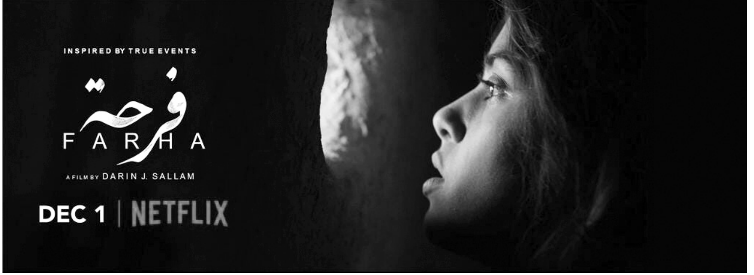
أفيش الفيلم «فرحة» تحاول أن تنظر للعالم الخارجي من ثقب بالحائط

فيلم يعرض ملامح الحياة الفلسطينية البسيطة وكيف قامت إسرائيل على جثث الفلسطينيين