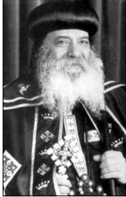
بقلم ميثاق الرحمة طبيب الذكر المتبحر: