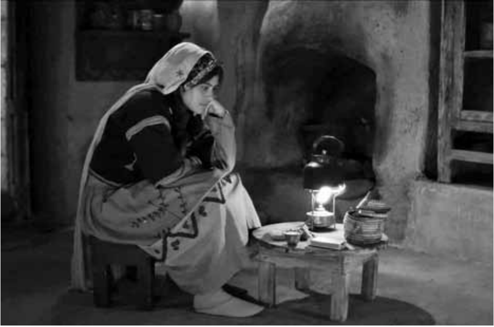
فرحة داخل القبو المظلم تحاول إشعال شمعة

ويبقى سؤال يطرح نفسه لماذا قدمت مخرجة الفيلم شخصية الخائن في صفوف الفلسطينيين في حين لم يرد من قبل طرح لهذه الشخصية تاريخياً أو فيما قدم من أعمال فنية عن القضية الفلسطينية؟ وهل هذا الطرح في صالح القضية أم لا؟