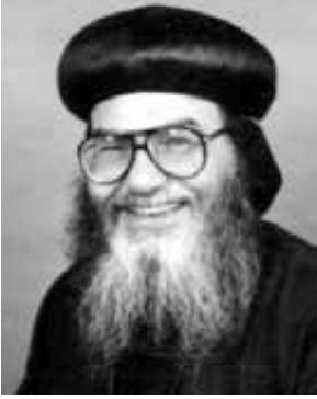
ثيافة الأنبا موسى