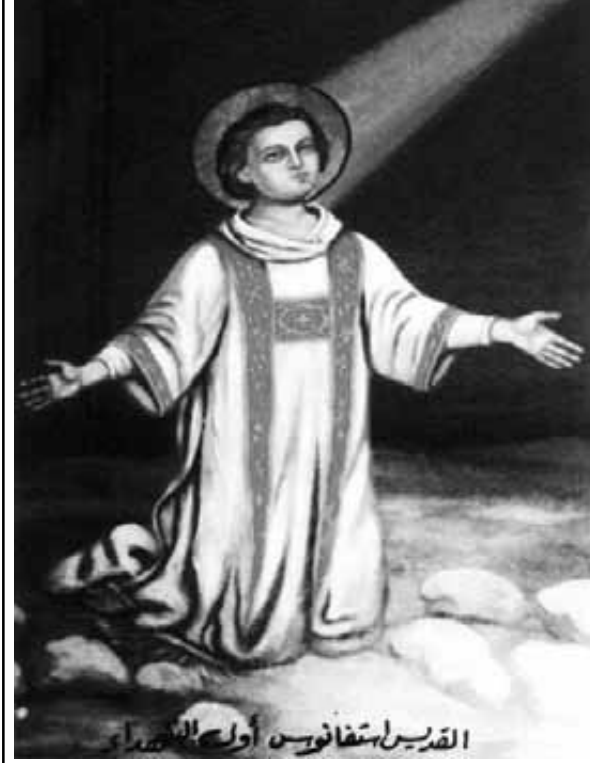
القديس استفانوس أول أساقفة الإسكندرية