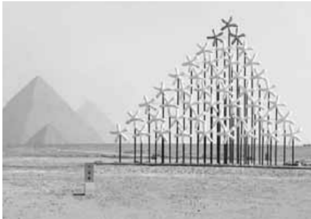
"As Above So Below (Dome of Starry Sky)"