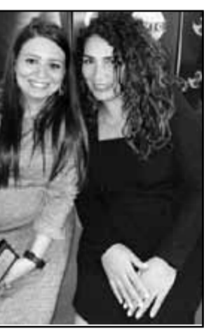
«وطى» مع بطلة الفيلم الفائز بالجائزة الأولى