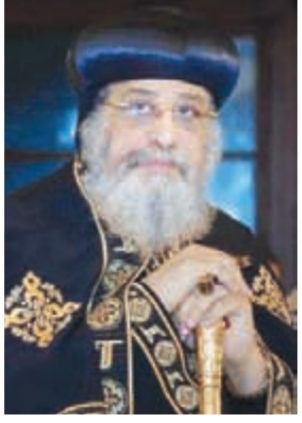
كنيهة للخدمة في المناطق التي برعما نيافة الأنبا جوزيف الاسقف العام بالاسكندرية، وتضمنت رسامات اليوم الشامى ٢٥ كاهناً للخدمة بالكنايس

فكتور سلامة احتفلت الكنيسة القبطية الأرثوذكسية بومى الخميس والجمعة الماضيين بسيامة ٥٢ كاهناً جديداً بيد قداسة البابا تواضروس الثاني، حيث ترأس قداسه قداسي الرسامات بالكاتدرائية الكبرى بدير القديس الأنبا يشوي بواى الطرون بمشاركة نيافة الأنبا اغابيوس اسقف ورئيس الدير، وعدد من اسبابر الكنيسة الابهاء الاساقفة، والقمص سرجيسو سرجيسو وكيل عام بطريركية الاقباط الارثوذكس بالقاهرة وعضو المجمع المقدس، وحضور لفيف من الابهاء الكهنة والرهبان. تضمنت رسامات الجديدة في اليوم الاول ١٥ كاهناً للخدمة بالقطاعات الرسولية الاربعة بالاسكندرية، وثمانية كنيهة آخرين الشامى ٢٥ كاهناً للخدمة بالكنايس