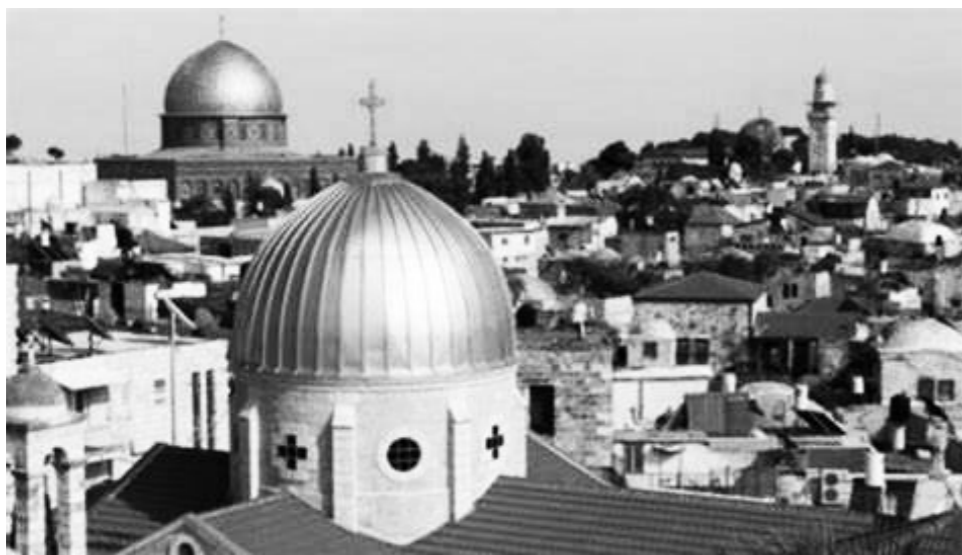
The patriarchs and heads of Churches in Jerusalem issued a joint statement on 10 November 2023 regarding Christmas celebrations in the Holy Land. The statement reads:

These have been opinions written by Jewish writers in an Israeli paper. What better testimonies?