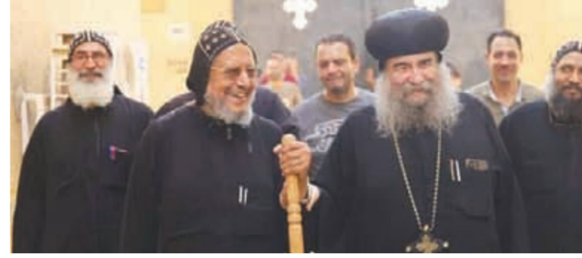
الأنبا مرقس والأنبا يوانس خلال الاحتفالات