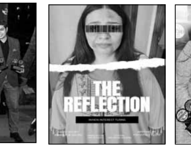
بوستر فيلم انعكاس