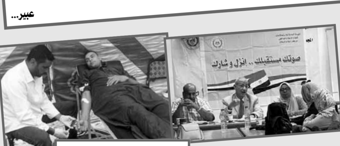
عبيد... صوته مستقبلك... أنزل وشارك