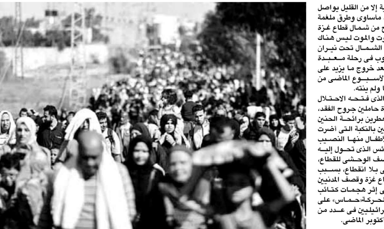
غزة تحولت لمقبرة للأطفال.. والولادة تحت القصف تهدد الرضع والأمهات

بخطوات ثقيلة وأبعاد خاوية إلا من القليل بواصل أهل غزة تزوجهم، فى مشهد مأساوى وطرق ملغمة بالمخاطر، إنها رحلة النزوح من شمال قطاع غزة إلى جنوبه ومسا بين الموت والموت ليس هناك اختيار فأما البقاء فى الشمال تحت نيران الاحتلال، أو النزوح للجنوب فى رحلة معقدة بأهوال القصف والجوع، فبعد خروج ما يزيد على مئة ألف فلسطينى فى الأسبوع الماضى من مناطقه لا يزال الخطر قائما ولم ينته. على طريق صلاح الدين، الذى فتحه الاحتلال لعبور النازحين يمر أهل غزة حاملين جروح الفقد، وأحزان الوطن المنكوب، معترلين برائحة الحنين للشهداء والمفقودين، ملتحفين بالكعبة التى أضرت الجميع وكان للنساء والأطفال منهن النصيب الأعمق جراء الوضع اليائس الذى تحول إليه سكان القطاع على أثر القصف الوحشى للقطاع، الذى دخل شهره الثانى بلا انقطاع، بسبب العدوان الإسرائيلى على قطاع غزة وقصف المدنيين بحجة تصفية حماس على إثر هجمات كتائب القسام والزراع العسكرية لحركة، حماس» على مدنيين وعسكريين إسرائيلىين فى عدد من المستوطنات فى الأسابيع من أكتوبر الماضى.