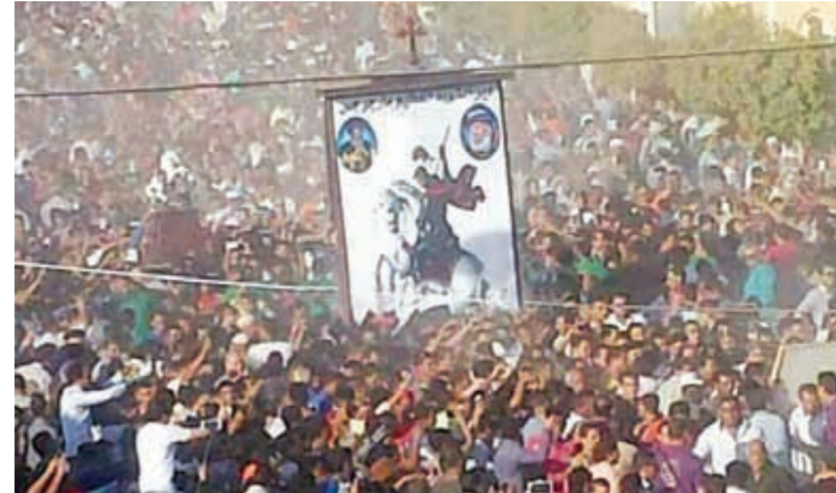
الزفة بدير مارجرس بالرزيقات

«كان بطلا شجاعاً في الحروب وفي الدفاع... والصلب وقت الفتح أقوى من السلاح... مارجرس بمارجرس صلوات مقبولة ومضمونة عند إيسوس بخرسوس، احتفلت الكنائس الأسبوع الماضي بعيد تكريس أول كنيسة لأمر الشهداء مارجرس ببلدة اللد بفلسطين.