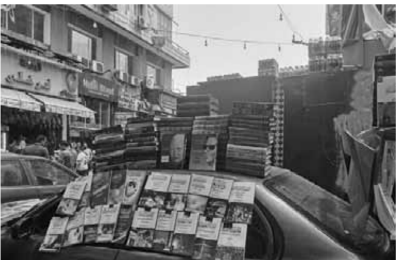
«سوق ديانا» للتحف والمقتنيات التراثية

أحد بائعي ديانا، لدى العديد من المقتنيات المميزة المارة بأبحاث في التاريخ، سوق ديانا سلاح ذو حدين