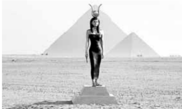
"Femme sous la forme de la déesse Hathor"

«Forever Is Now 03: L'avenir est à nous» est une ode à l'enchantement du patrimoine culturel de l'Égypte ancienne, et les installations contemporaines témoignent de l'évolution continue de l'art. Se déroulant à une époque tumultueuse qui voit notre présent perturbé de multiples façons, l'exposition est un hommage à la continuité de notre civilisation et à notre quête incessante de la vie. L'espoir et la foi sont ancrés dans notre connaissance du passé et dans la croyance inébranlable qu'il n'y a pas de conception de l'avenir sans histoire.