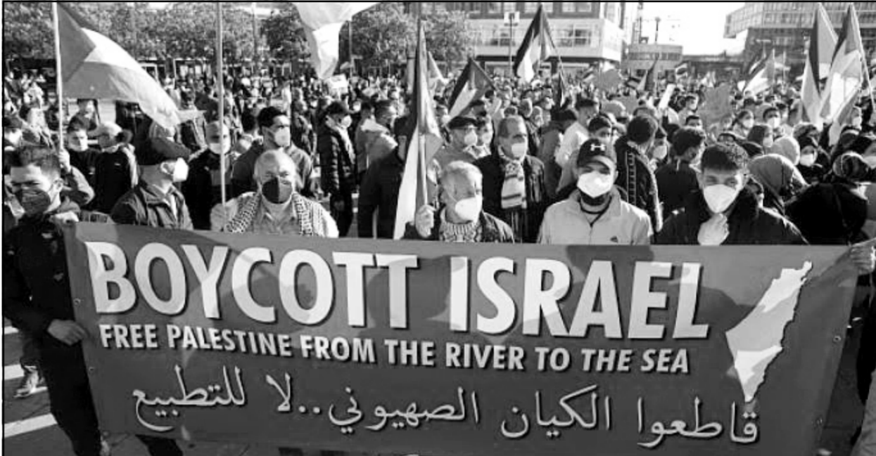
دعوات لمقاطعة منتجات الشركات الداعمة لإسرائيل

ويالتالى بتضرر الاقتصاد المصرى، فضلا عن أن هذا من الممكن أن يفزع الاستثمار الأجنبي فى المستقبل من قدومه إلى مصر، ونحن فى حاجة إلى استثمار أجنبي لتعويض نقص المخدرات وحتى يتم زيادة معدل النمو الاقتصادى.