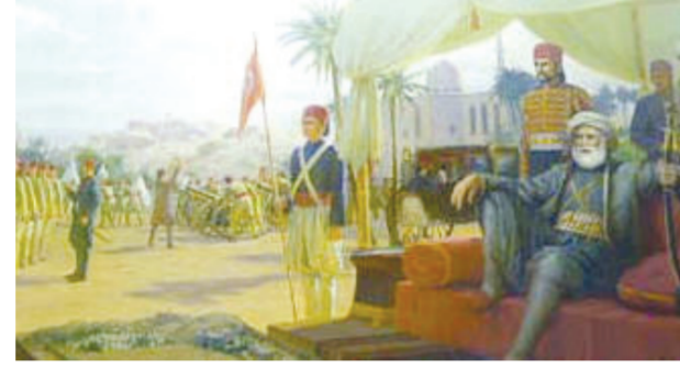
محمد علي باشا .. يستعرض الجيش المصري

الجيش في الأسرة السادسة تغير شكل ورتب الجيش في هذه الفترة كثيراً، إذ لم يعد هناك فرق «عبر» بل أصبح الجيش مقسماً إلى فصائل «نحسي» مجموعة حسب تعداد الإقليم الذي جندت فيه على رأسها أمير المقاطعة، أما جيش المرتزة فقد بقي تحت قيادة رؤساء مختصين وهم فواد الجنود المرتزة «إمرا جيس بر». وظهرت رتبة جديدة هي «مدير القوافل»، وهي وظيفة ضباط مختلفي الرتب، وقد اعتاد علماء