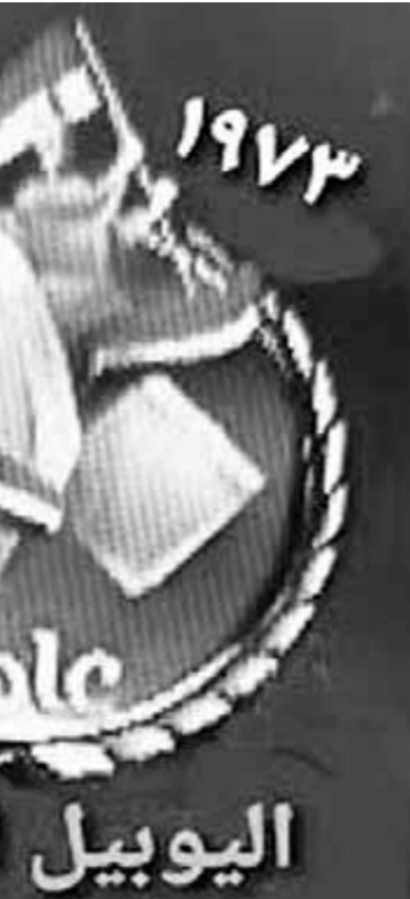
لوجو احتفال القوات المسلحة بخمسين سنة على حرب أكتوبر

وطلبت مائير من كيتنج خلال اجتماعهما نقل رسالة إلى مصر مفادها أن إسرائيل مستعدة لصد أي هجوم وليس لديها شك في أنها ستتنصر، بحسب ما جاء في إحدى الوثائق.