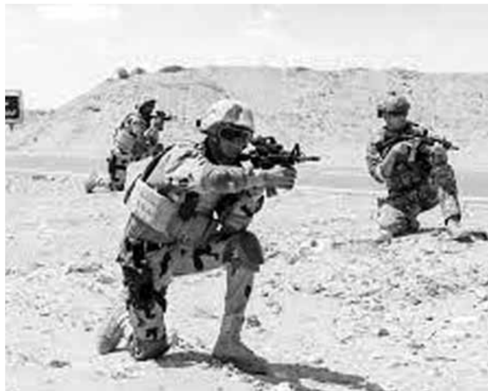
تدريبات النجم الساطع مصر والولايات المتحدة و٣٤ دولة أخرى ٢٠٢٢

منذ أيام وعلى مدار خمسة عشر يوماً استضافت قاعدة محمد نجيب العسكرية فعاليات التدريب العسكري المصري الأمريكي المشترك النجم الساطع ٢٠٢٢، والذي شارك فيه أكثر من ٨٠٠ مقاتل من ٢٤ دولة مختلفة، في تدريب يوصف بأنه من أكبر التدريبات في الشرق الأوسط وتأكيداً على العلاقات العسكرية الاستراتيجية بين مصر والولايات المتحدة. أعدت القوات المسلحة تقريراً معلوماً حول حصاد التدريبات المشتركة خلال عام ٢٠٢٢، والذي تضمن ٢٩ تدريباً عسكرياً مشتركاً، بينها ٢٢ تدريباً داخل حدود