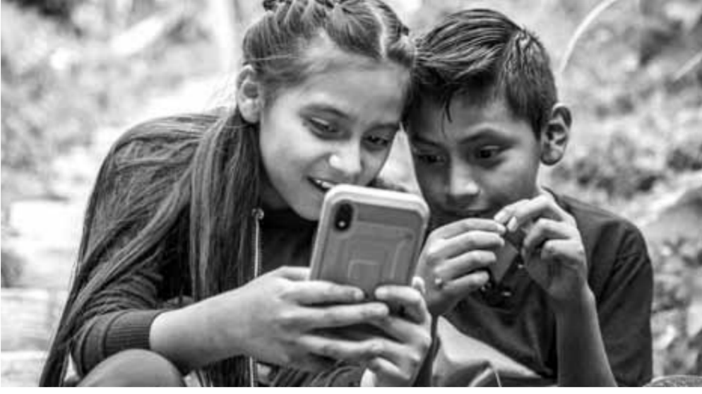
خطر يهدد أطفالنا