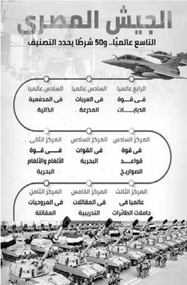
تصنيف الجيش المصري