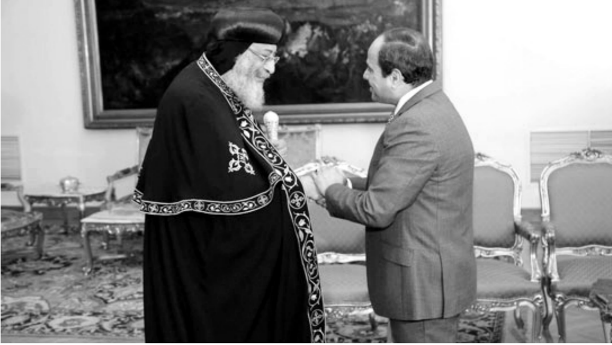
الرئيس السيسي وقداسة الببايا صورة أرشيفية،

يرى الأعمال الإرهابية التي استهدفت الكنائس، بل استهدفت الكاتدرائية المرقسية وهي مقره، ولكن كان الشغل الشاغل لقساسته الوطن، ولذا جاءت عبارته الشهيرة بعد الأعمال الإرهابية عقب ضاعت اعتصام اربعة وحرق ٨٤ كنيسة، ليقول «وطن بلا كنائس خير من كنائس بلا وطن»، ليؤكد أن كنيسةنا وطنية ولا غبار عليها، بل صمدت الكنائس ضد الإرهاب والشهداء، وتحولت كنائسنا المصرية بكل طوائفها وأقباط مصر بالمهجر لسفراء لدعم بلادنا ضد الإخوان وتصحيح صورة مصر أمام العالم أمام أكاذيب الجماعة الإرهابية.