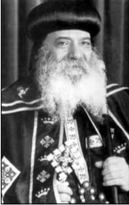
بقلم مثالث الرحمتا طبيب الذكر المتبحر: البابا شنودة الثالث