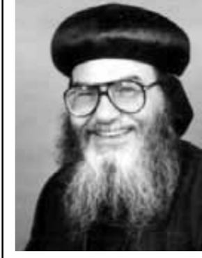
لنيافة الأبنا موسى أسقف الشباب

٢- أنه أبرز السيد كمللهذا تكورت كلمة الملكوت ٣٢ مرة في (بشارته). ٣- أوضح لهم أن المسيح هو ابن داود (مزمور ٧ مرات). ٤- استخدم الأرقام المفضلة عند اليهود (مثل ٧، ١٠، ٤٠) فتحدث عن ثلاث مجموعات في نسب السيد المسيح كل منها أربعة عشر جيلاً، وأورد خمسة أحاديث للسيد المسيح، وسبعة أمثال أساقفة المملكوت في أصحاح ١٣... وهكذا.