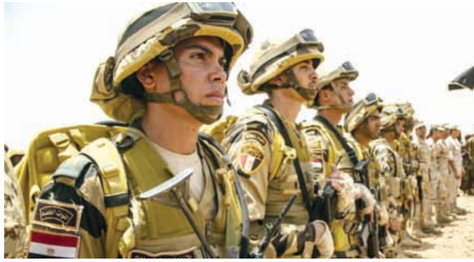
الجيش المصري في العصر الحالي