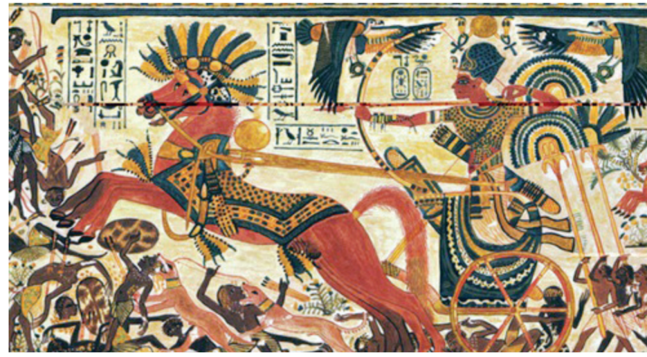
الفرعون القائد الأعلى لجيش مصر