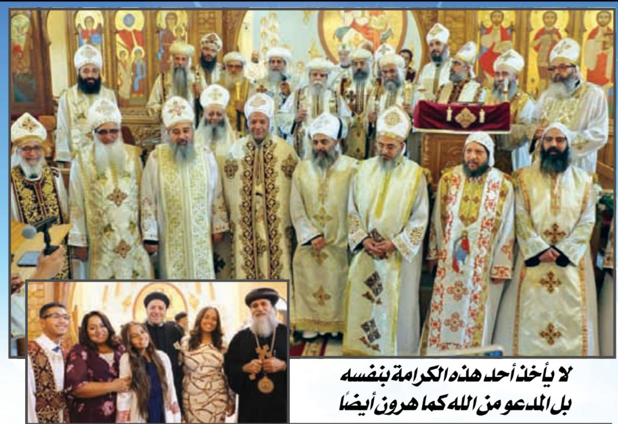
لا يأخذ أحد هذه الكرامة بنفسه بل المدعو من الله كما هرون أيضاً

الغضب الشعبي المتزايد من حالة اللاحرب القائمة... العدو ابتلع الطعام ويات يقينه أن التحركات الأخيرة ليست سوى سابقاتها التي انتهت إلى لا شيء. ●● الأربعاء ٣ أكتوبر تسارعت الأحداث السياسية والعسكرية على الجبهتين المصرية والسورية، ففي ليل هذا اليوم دخل العتاد الهندي إلى الجبهة: براميط الكباري والعدوات الدخلة في إنشائها وظلميات المياه والأسلحة الثقيلة، والقيادة العسكرية على درجة استفزاز غير مسبوقة خوفاً من رصد العدو ومع طائرات التجسس الأمريكية والأتعمار الصناعية تلك التحركات. ●● تحدد يوم السبت ٦ أكتوبر لبدء العمليات، وذلك بناءً على دراسات دقيقة للوصول إلى اليوم الذي يحمل أقل السليبوات وأكبر الإيجابيات، فذلك اليوم عند العدو يوافق عيد الغفران وفيه تتعطل جميع مظاهر الحياة ويلزم الجميع بيوتهم وتتوقف المواصلات، الأمر الذي يؤدي إلى تأخير حتمي في إعلان التعبئة وضمان تأمين القوات المصرية في اقتحامها للقناة وإقامتها رؤوس الكباري والمواقع الدفاعية المنوط بها صد أي هجوم لديابات العدو. ●● لم تتعافل إسرائيل عن تحركات المصريين على الجبهة وقامت جولدا مائير رئيسة الوزراء، بدعوة مجلس الحرب للانعقاد، حيث تم عرض الموقف من جميع جوانبه، وأقاراً ممثل جهاز الخبروات الإسرائيلية أن مصر لا تستعمل أن تخوض حرباً، وأن ما يحدث وتم رصده من تحركات تعزى إلى مناورة تخص الجبهة الداخلية في مصر... وأن إمكانيات إسرائيل كقوة برع أي نوايا، وأوصى بعدم جدوى التعبئة. ●● يوم السبت ٦ أكتوبر تم إبلاغ قادة الجيش بموعد الحرب مع جدول توزيع التوقيتات على المستويات المختلفة... إذا تم إعلان ساعة الصفير لبدء العمليات، وظل هناك هاجس خطير: هل لم يلحق العدو أو يرصد التحركات منذ أول أكتوبر... هل إجراواتنا على هذه الدرجة العظيمة