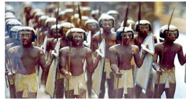
تمائيل فرعونية تمثل الجنود المصريين

الوزارة في الملكية، وكان عمله مقتصرًا على التكمّل عن السلطان في مجلس الاستشارة، وكان يتقاضى ١٢٠ جنينها شهراً، تأتي بعده «أمير اللواء» وهو رئيس الفرقة المركبة في الأولوية، وكان يتقاضى ١١٠ جنينها بالشهر، ثم لواء «مكدا» يطلق اليوم وأصله عندهم أمير لواء، ويعد رتبة «مير الآي» بمعنى أمير فيلق، وهي كلمة مركبة تتكون من مقطعين «مير» مستحصراً «مير» والأي بمعنى الفيلق، وكان راتبه ٨٠ جنينها شهرياً، والرتبة التي تليه هي «قائم مقام»، أي قائم مقام الأمير في رئاسة الآي، وكان يطلق على وكيل أمير الآي ثم صار الآن يعين لقيادة الأوترة، وكان يتقاضى ٣٠ جنينها شهرياً ثم رتبة «الكباشي» وهي كلمة مركبة من «بيك» بمعنى ألف ونقرأ الكاف نوناً، ومن باش بمعنى رأس، وهو رئيس الف ويتقاضى ٢٥ جنينها شهرياً.