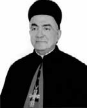
الطران جورج شيحان مطران الموارنة بالقاهرة والرئيس الأعلى للمؤسسات المارونية في مصر

يرجمونني! فقال الرب لموسى من قدام الشعب وخذ معك من شيوخ إسرائيل. وعصاك التي بها ضربت النهر خذها في يدك وأذهب. ها أنا أقف معك أمامك هناك على الصخرة في حوريب، فتضرب الصخرة فيخرج منها ماء ليشرب الشعب. ففعل موسى هكذا أمام شيوخ بني إسرائيل. وشد الرب صخرة فخروج منها ماء للشعب. فأخرج الرب ماء من الصخرة، وأروى الشعب كله.