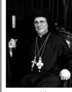
الطران كريكورا أوغوستينوس كوسا أسقف الإسكندرية للارمن الكاثوليك

ولد القديس فرنسيس عام ١١٨٠ في مدينة أسيزي الإيطالية، وهو ابن أحد تجار الألبسة الأثريين في أسيزي. في أول شبابه كان يعيش حياة الترف، وقد نال فسطه من التعليم، وشارك في الحرب بين مدينتي أسيزي، ومدينة بيروجيا، فأخذ فيها أسيراً، عانى خلالها من مرض شديد، ربما كان أول سبب لبعثه في تعال وتبني.