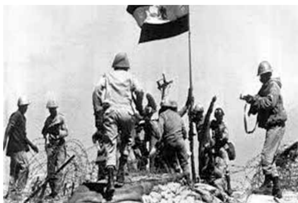
جانب من انتصارات حرب أكتوبر

وذكر أنه لم يكن انتصار أكتوبر هو النهاية بل استمرت القوات المسلحة في الحفاظ على الأمن القومي المصري واستقراره، فعملت على استكمال استعادة الأرض من خلال استمرار نصر أكتوبر ١٩٧٣ مباشرة نحو المفاوضات، وأدركت مصر أهمية مشاركة الولايات المتحدة الأمريكية كراع للسلام بدلاً من الأمم المتحدة، لاسيما في ظل عدم تنفيذ بعض قرارات مجلس الأمن، وجاءت زيارة الرئيس الراحل محمد أنور السادات في ١٩ نوفمبر ١٩٧٧ إلى القدس، إلى أن وقعت معاهدة السلام بين مصر وإسرائيل في واشنطن في ٢٦ مارس ١٩٧٩، ثم توالى عملية استكمال المفاوضات لاستكمال عملية استعادة الأرض وعودة طايا آخر بقعة إلى أرض مصر ورفع العلم المصري في