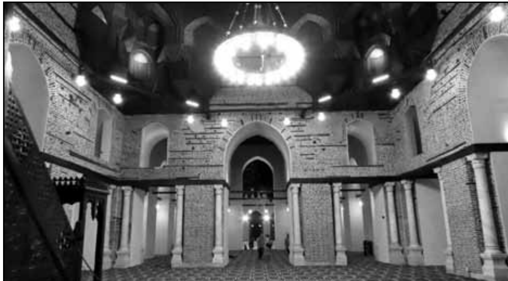
مسجد الظاهر بيبرس من الداخل