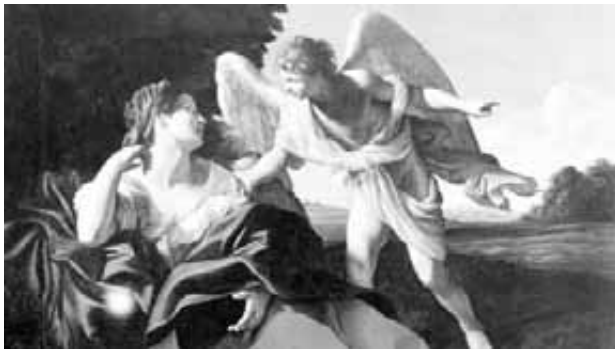
Agar secourue par l'ange