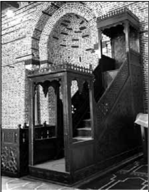
محراب المسجد والحوائط بعد أعمال الترميم