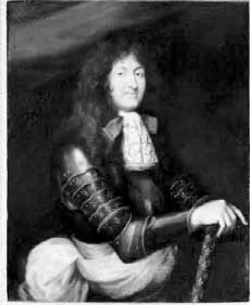
Portrait de Louis XIV

Pour le reste, difficile de se prononcer donc, puisque ces tableaux dont s'entourait le roi – de plus en plus pieux à la suite de son mariage avec Madame de Maintenon – pouvaient aussi bien être de l'ordre, selon l'historien, de la simple «dédicace esthétique».