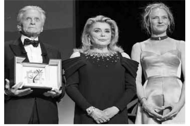
اطلالات الفنانات باحدث صحيات الموضة