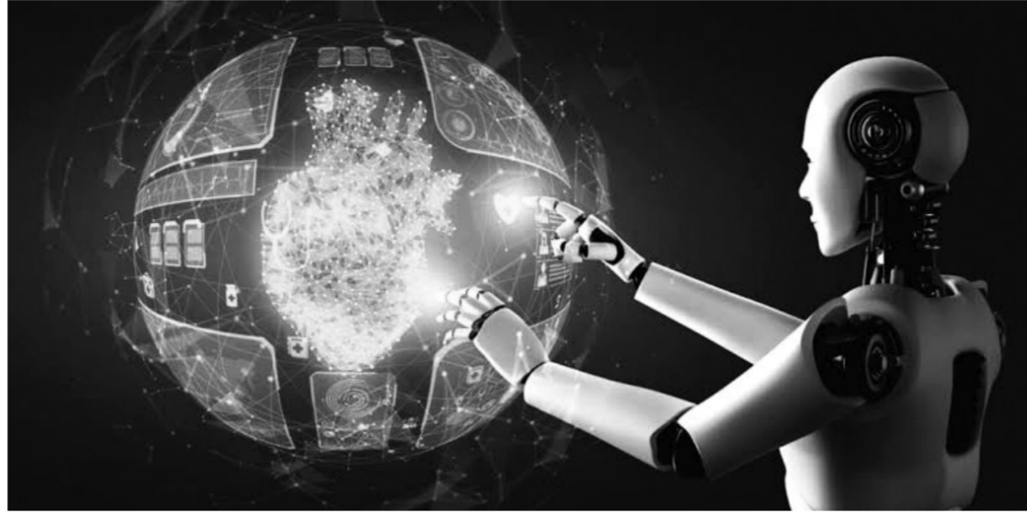
ثورة الذكاء الاصطناعي