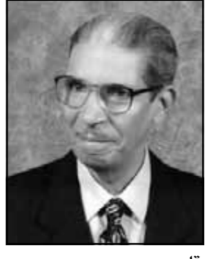
بـقلم: يعقوب الشاروني رائد أدب الأطفال yaocoubsharouny@yahoo.com

(١) : إجابة إبداعية: سؤال المدرس تلميذه: «ما هو محور الأرض؟» أجاب التلميذ: «محور الأرض هو خط خيالي، يمر من أحد القطبين إلى قلب الأرض الآخر، وحوله تدور الأرض حول نفسها.» وجد المدرس أن التلميذ كان يجب أن يقول إنه «خط خيالي» وليس «خطاً خيالياً»، لذلك عاد ويسأله في شيء، من السخرية: «هل يمكنك تعليق سلاسل على هذا الخيط؟» في سرعة إجاب التلميذ: «نعم يا أستاذ.» وفي دهشة بالغة سأل المدرس: «حسباً! وأي نوع من الملابس؟» أجاب التلميذ في ثقة: «ملابس خيالية يا أستاذ!!» (٢) : إبداع وتجديد في عالم المسابقات ١٤٠٠ كاتب وكاتبة اشتركوا في مسابقة قومية كبرى لكتابة الرواية والقصة للأطفال، كتبوا عن الغابات التي لا توجد في مصر ولا في معظم أنحاء الوطن العربي، وقيل منهم كتب عن الريف الذي هو معظم أرض مصر المعروفة، ولم يكتب أحد عن الصحراء التي تغطي ٧٦٪ من أرض مصر. لهم كتبوا قصصهم ورواياتهم عن طريق كلمات على الورق، التاد منها متميز جداً، وقيل جيد، وكثير يحتاج إلى التمثل حتى تصنع الروبة. ولكن