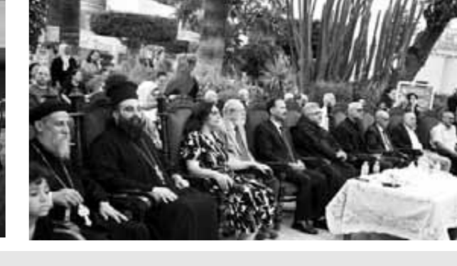
صور من احتفالات المتحف بعيد تذكار دخول العائلة المقدسة مصر