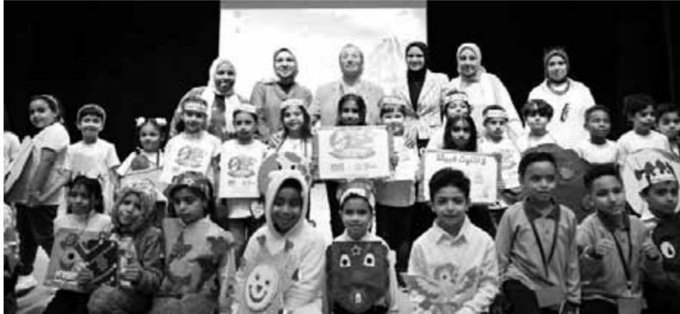
مشاركة طلاب المدارس في احتفال الإسكندرية بيوم البيئة العالمي

نصف قرن من المعارك الدائرة بين الإنسان والطبيعة.. نصف قرن من الانتصارات التي لم تمنع الهزائم، لكنها تحاول تقويض آثارها على البشر، منذ انطلاق اليوم العالمي للبيئة في الخامس من يونيو من العام ١٩٧٣، وحتى الآن إذ يصادف عام ٢٠٢٣ الذكرى الخمسين للاحتفال باليوم العالمي للبيئة، وعلى مدى العقود الخمسة الماضية، أصبح اليوم العالمي للبيئة أحد أكبر المنصات العالمية للتوعية البيئية، يشارك فيها عشرات الملايين من الأشخاص جنباً إلى جنب مع الحكومات والشركات والمدن والمنظمات المجتمعية. لذلك تهتم به المنظمات الأممية وعلى رأسها الأمم المتحدة، وكذلك الجهات الوطنية المصرية تقودها وزارة البيئة، وتعتبره فرصة لإدخال القضايا ذات الأهمية القصوى إلى غرفة إنعاش الوعي المجتمعية.