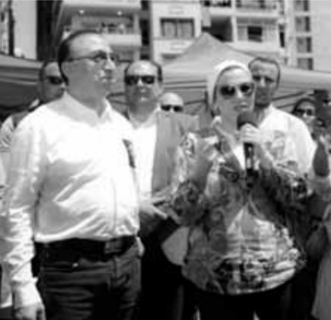
وزيرة البيئة مع محافظ الإسكندرية على شاطئ السرايا