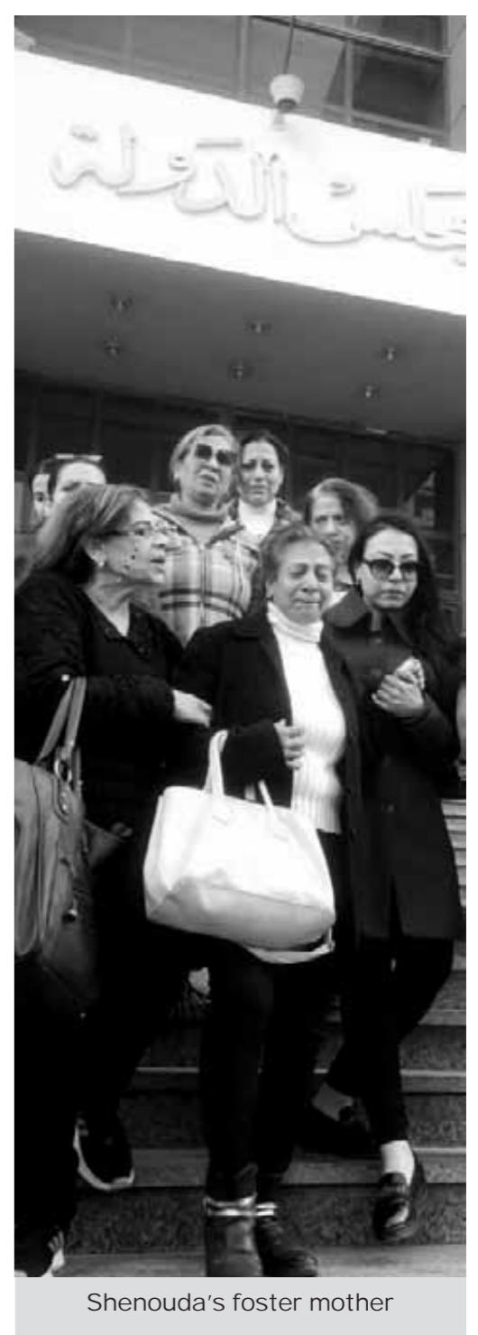
Shenouda's foster mother

For now, however, Shenouda remains at Dar al-Orman orphanage, and his adoptive parents remain at home praying for a happy court ruling on 18 March.