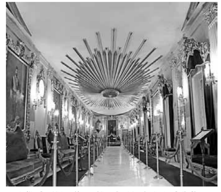
سقف قاعة سراي العرش مغلف بقوس الشمس وأشعتها الذهبية وبالأركان الأربعة للسقف أجزاء من هذه الأشعة