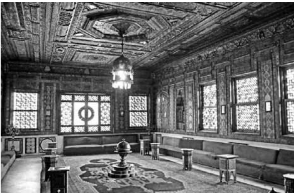
القاعة الشامية - سراي الاستقبال

أما غرفة «الصالون الأزرق» كان يستخدمها الأمير في الاجتماعات الأسرية الخاصة، وجدرانها مغطاة بالبلاط