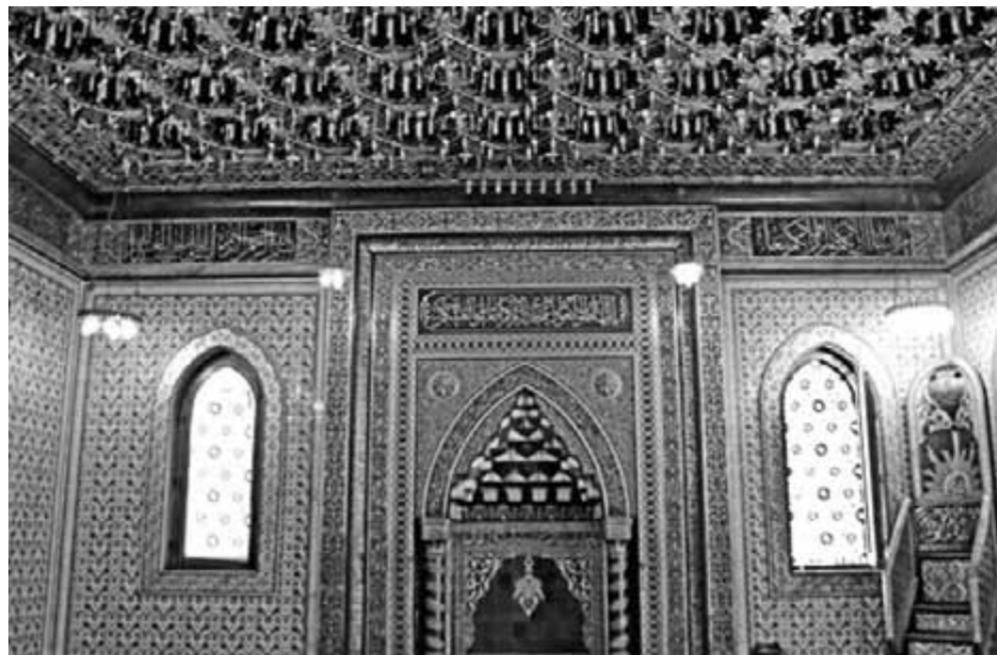
محراب ومئذنة مسجد الأمير محمد علي