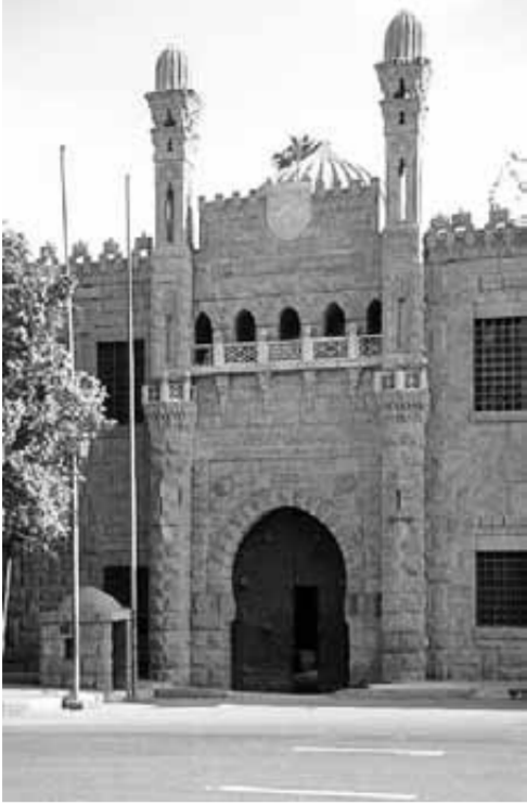
بوابة دخول القصر