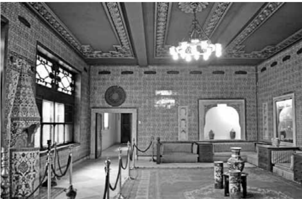
القاعة الشتوية ومغليتها أرضياتها بالسجاد التركي والمزهريات الصينية من الخزف الأزرق والأبيض