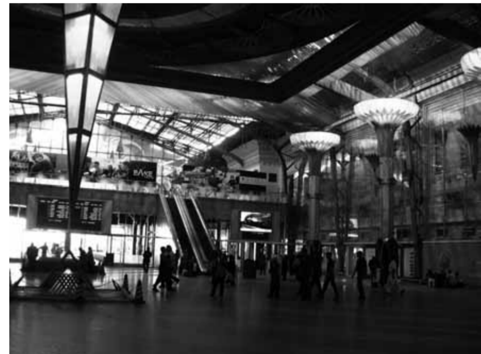
محطة قطارات بشتيل تمهيدا لافتتاحها