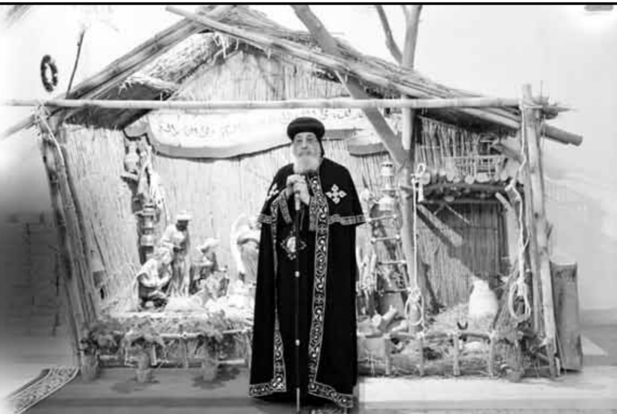
Devant la crèche à l'intérieur de la résidence papale, le Pape adresse le message de Noël aux Coptes du monde entier

A l'occasion de Noël et du nouvel an 2023 le pape Tawadros II, pape d'Alexandrie et patriarche de la prédication de Saint-Marc, a adressé un message qui a été traduit en plusieurs langues dont l'anglais, le français, l'allemand, l'italien, le chinois, le japonais, le suédois et le danois pour féliciter les Coptes d'Égypte et la Diaspora.