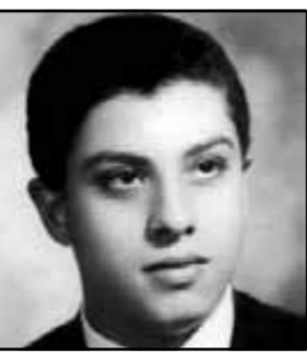
انكروا أمام عرش النعمة

مع المسيح ذاك أفضل جداً الميلاد السماوى العاشر لعريس السماء البيار...التقى...التقى نصير حبيب نصير