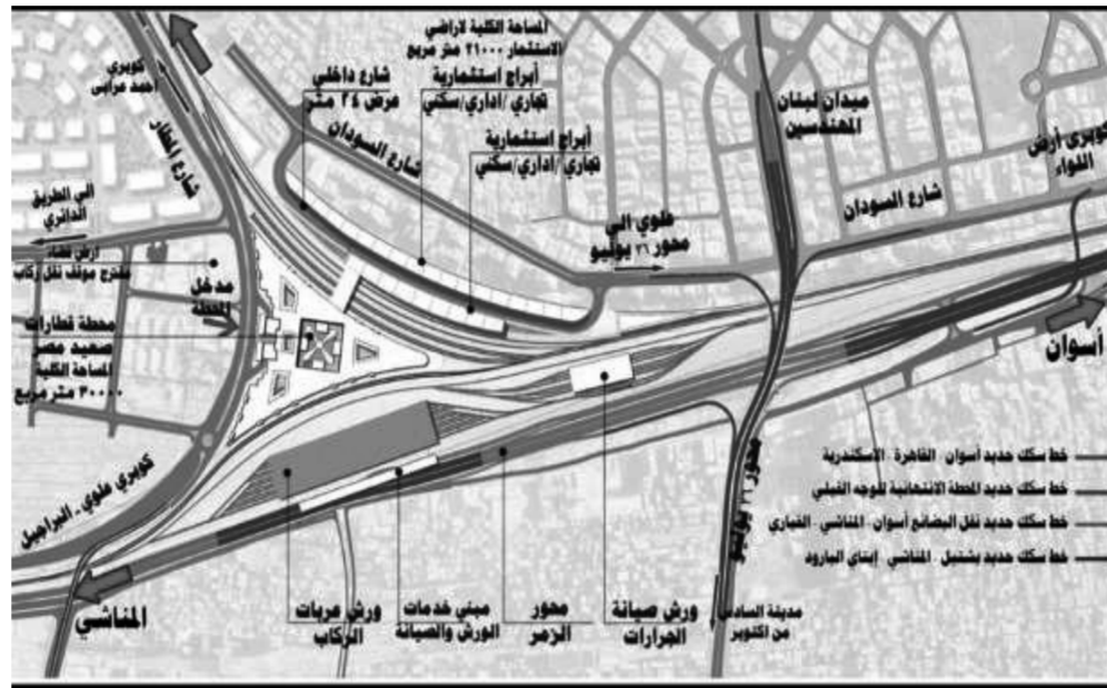
خريطة توضح موقع محطة بشتيل

تسابق الحكومة الزمن لانتهاه من مشروع «محطة قطارات بشتيل الجديدة» المخصصة للوجه القبلي التي تم إنشاؤها حالياً في محافظة الجيزة، والمقرر افتتاحها هذا العام، حيث تقع المحطة التي بدأ العمل بها في ديسمبر ٢٠٢٠، بين مطار إمبابة وشارع السودان ومحور ٢٦ يوليو لتكون منطقة وسطية بين محطتي سكك حديد القاهرة والجيزة، وتعد محافظة الجيزة بداية للوجه القبلي لمصر وبوابة للصعيد وتتميز المحطة بأنها تبادلية عملاقة ذكية ذات طابع فرعوني وتتميز بمستوى عالمي من الخدمات، وتستعد الحكومة لافتتاحها، والتي تعد بوابة لصعيد مصر كمنطقة التقاء خطوط السكك الحديدية الرئيسية بأربعة محاور رئيسية مثل محوري عرابي ٢٦ يوليو القديم، والطريق الدائري، وبعضها جار الانتهاء منه لافتتاحه قريباً مثل محوري ٢٦ يوليو الجديد والفريق كمال عامر ومشروع المونوريل ومترو الخط الثالث، الأمر يغير خريطة المواصلات في القاهرة الكبرى مع افتتاح المحطة.