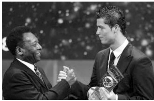
كريستيانو رونالدو ولقائه بالأسطورة