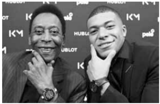
كليان مبابي والجوهرة السوداء

يقال الرئيس البرازيلى أوبز إيناسيو فى ١٩٦٧، فى حفل حضره ألف شخص، وهو الشبان البرازيليين، فقد رايت بيليه وهو يلعب فى كان يقدم عرضاً فنياً رائعاً، لأنه عندما كان يحصل على الكرة كان يقدم دائماً شيئاً مثيراً، والذي كان غالباً ما ينتهي بوضع الكرة داخل الشبان. وقال رئيس الاتحاد الدولى لكرة القدم جيسى إنفانتينو إنه حزين فى يوم من الأيام، فقال بيليه، أفضل رياضى فى القرن. كان يحظى بكاريزما هائلة، وكان العالم يتوقف عندما تكون معه، واليوم العالم كله يشعر بالحنن على رحيل بيليه، أعظم لاعب كرة قدم عبر كل العصور.