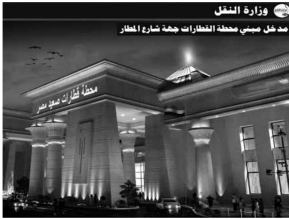
محطة قطارات بشتيل الجديدة بعد تجديدها

تستوعب ١٧٠ ألف راكب يومياً.. والافتتاح هذا العام بتكلفة إنشاء ٢,٦٥ مليار جنيه