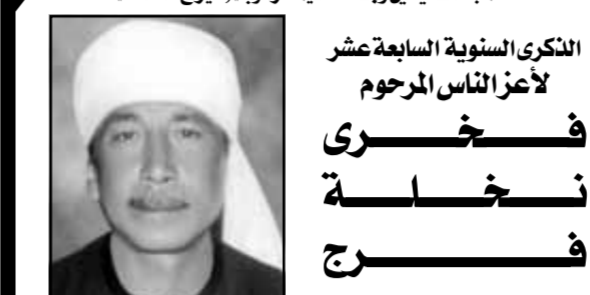
تقديم الأسرة صلاة القديس الإلهي لروحها الطاهرة السابعة صباح يوم الجمعة ٢٠٢٢/١٢/٩ بكنيسة رئيس الملائكة ميخائيل بالصوامعة غرب