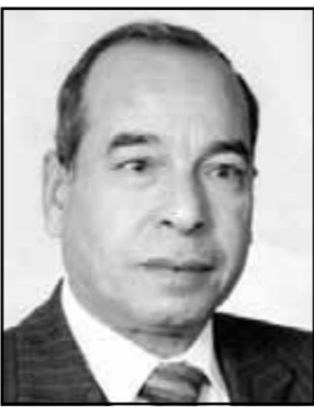
ماجد عطية مفكر وكاتب اقتصادي

أوروبا تتطلع إلى الفاز المصري وأمريكا تشجع تبادل المصالح ١٠٠ عام على ميلاد د. بطرس بطرس غالي وذكريات وحوارات معه