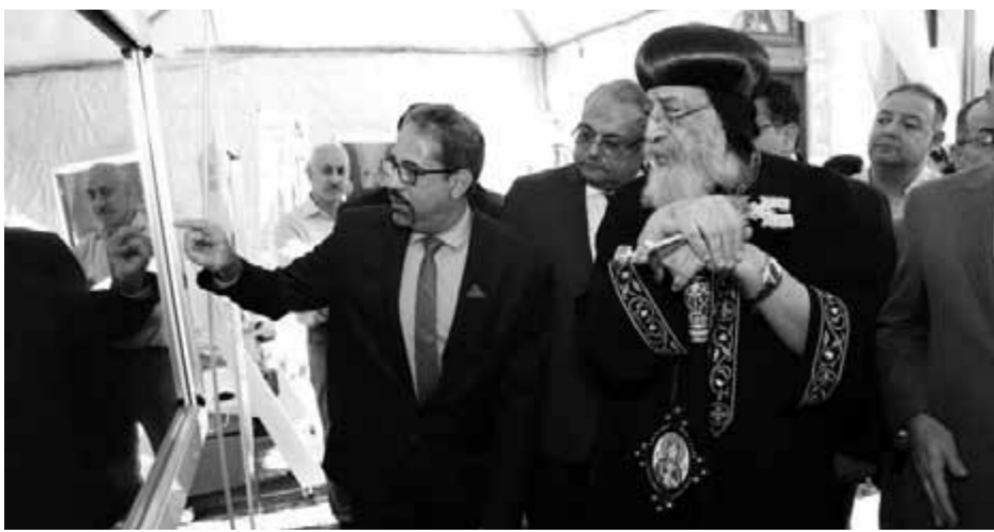
قداسة البابا يستمع لشرح الموقع

أو تكون مادة حبيسة الأراج مثل مجهود السنين الماضية، ولكنني أشهد أن بنظرة المستقبلية أجهد ووجد مصورا مضمواً ومساعدنا لنستكمل حلمنا الذي أصبح في ذلك الوقت حلماً تشارك معنا فيه مجموعة جميلة ومتنوعة من المصريين، فانسنا مؤسسة مصر المباركة التي أعلنت أول هدف لها هو الدعابة عن مسار العائلة المقدسة داخل وخارج مصر، وجاءت جانحة كورونا وكثرت اجتماعاتنا وتطور المشروع حتى اكتمل عام ٢٠٢٢.