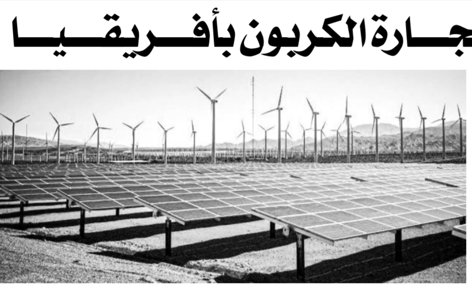
مصر تدخل سوق تجارة الكربون

وأوضح أنه فى سبيل ذلك سيتم إقامة المنطقة وفقاً لإطار المناطق الصناعية الصديقة للبيئة والعمل من جانب البنك الدولى ومؤسسة التعاون الأناطية GTZ، ويونيدو، مستخدمين فى ذلك أداة تنظيمية المناطق الصناعية والمعدة من جانب البنك الدولى، والتي تقوم على وضع رؤية استراتيجيية للتحويل الصناعى وتحديد الأولويات المناطية وتحليل خط الأساس على المستوى الاقتصادى والبيئى