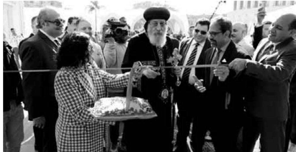
افتتاح الموقع الإلكتروني

أطلق قدااسة البابا تواضروس الثاني بابا الإسكندرية وبطريك الكرازة المرقسية، أول موقع إلكتروني لمسار العائلة المقدسة بتقنية VR، وسبع لغات لجميع النقاط التي مر عليها السيد المسيح برفقة السيدة العذراء، ويوسف النجار داخل مصر. ويتضمن الموقع تقنية التجول الافتراضي التي تتيح إمكانية زيارة الأماكن المباركة لمسار العائلة المقدسة في مصر افتراضياً وروية كل تفاصيلها إضافة إلى صور متنوعة وعروض بالفيديو ومعلومات مفصلة عن كل نقطة بلغات سبع وهي العربية والإنجليزية والفرنسية والألمانية والإيطالية والإسبانية والروسية. وقال قدااسة البابا تواضروس الثاني خلال إطلاق الموقع: إن المشروع متعدد الفوائد ليس فقط من الناحية البيئية، ومصر تميزت بأن مسار العائلة المقدسة داخل حدودها دون غيرها من دول العالم، فضلاً عن تضمن المسار لإعداد متعددة منها الروحي والفنسي والسياحي والأثري والتاريخي والوطني القومي إضافة إلى البعد الاقتصادي، وأن المشروع من شأنه تحقيق جوانب إيجابية وأشار قداسته بالاهتمام المؤسسة بأقسام وترجمة كل خطوات الحجاجات متعددة ليعمل أكبر شريحة من الناس حول العالم، وأن الإضافات التكنولوجية ستجعله أكثر جذباً للصغار والكبار على حد سواء، متمنياً أن يكون للمشروع مكان ثابت يسمح بالزيارة المستمرة على مدار اليوم.