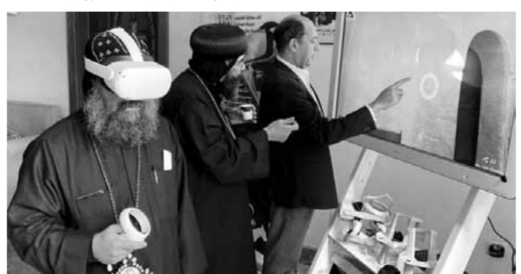
قداسة البابا يستكشف عالم الـVR