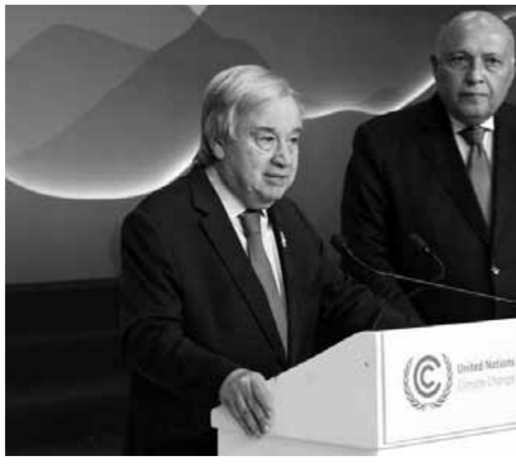
أمين عام الأمم المتحدة أنطونيو جوتيريش والوزير سامح شكرى رئيس القمة

على أثر تلك الاحتجاجات، أطلق نائب رئيس المفوضية الأوروبية، فرانس تيرمرمان، اقتراحاً نيابة عن الاتحاد الأوروبي من شأنه أن يوافق على إنشاء صندوق للخسائر والأضرار، ملحقاً أن الاتحاد الأوروبي استمع إلى مجموعة الـ ٧٧ للدول النامية، التي تعتبر إنشاء صندوق في هذه القمة مطلباً أساسياً لها، وقال تيرمرمان: «كما مترددين بشأن إنشاء صندوق، لم تكن فكرتنا أن يكون لدينا