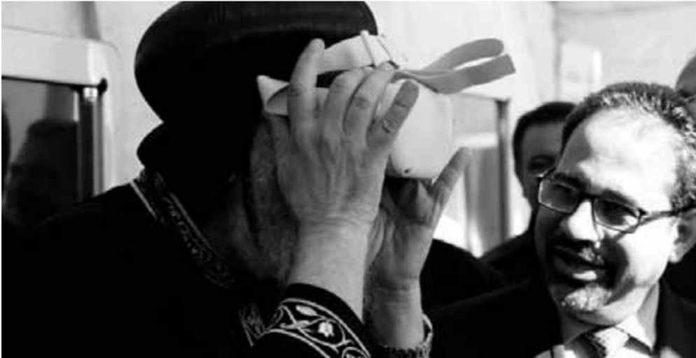
قداسة البابا يستكشف عالم الـVR