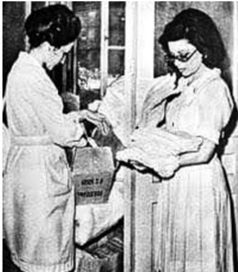
فاتن حمامة وتجهيز مستلزمات الجنود

وكان زوجها يشاركها أيضًا في العملية الفدائية ضد الإسرائيليين وكان يحمل معها الرسائل والمفرقات ويعبرها بها قناة السويس بقوارب بسيطة حتى يصلها إلى سيناء