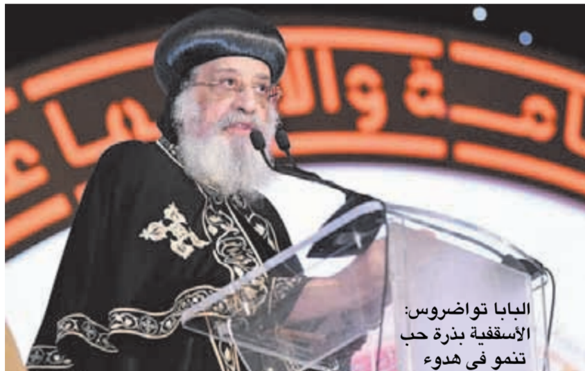
البابا تواضروس: الأسقفية بذرة حب تنمو فى هدوء