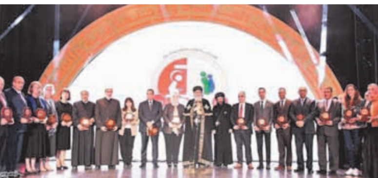
البابا تواضروس يكرم شركاء النجاح