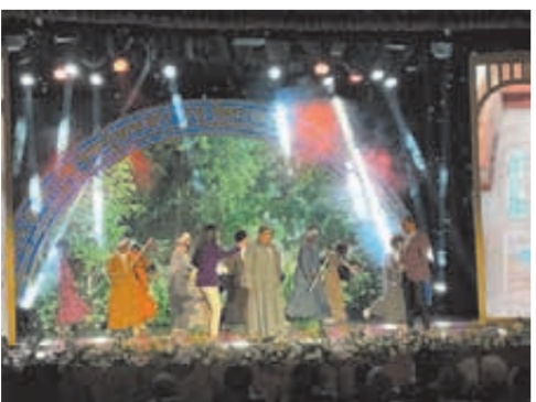
مصر فيها الخير وكل الخير جاى