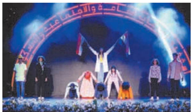
الكنيسة القبطية بايد تصلى وبايد تبني من أجل مصر