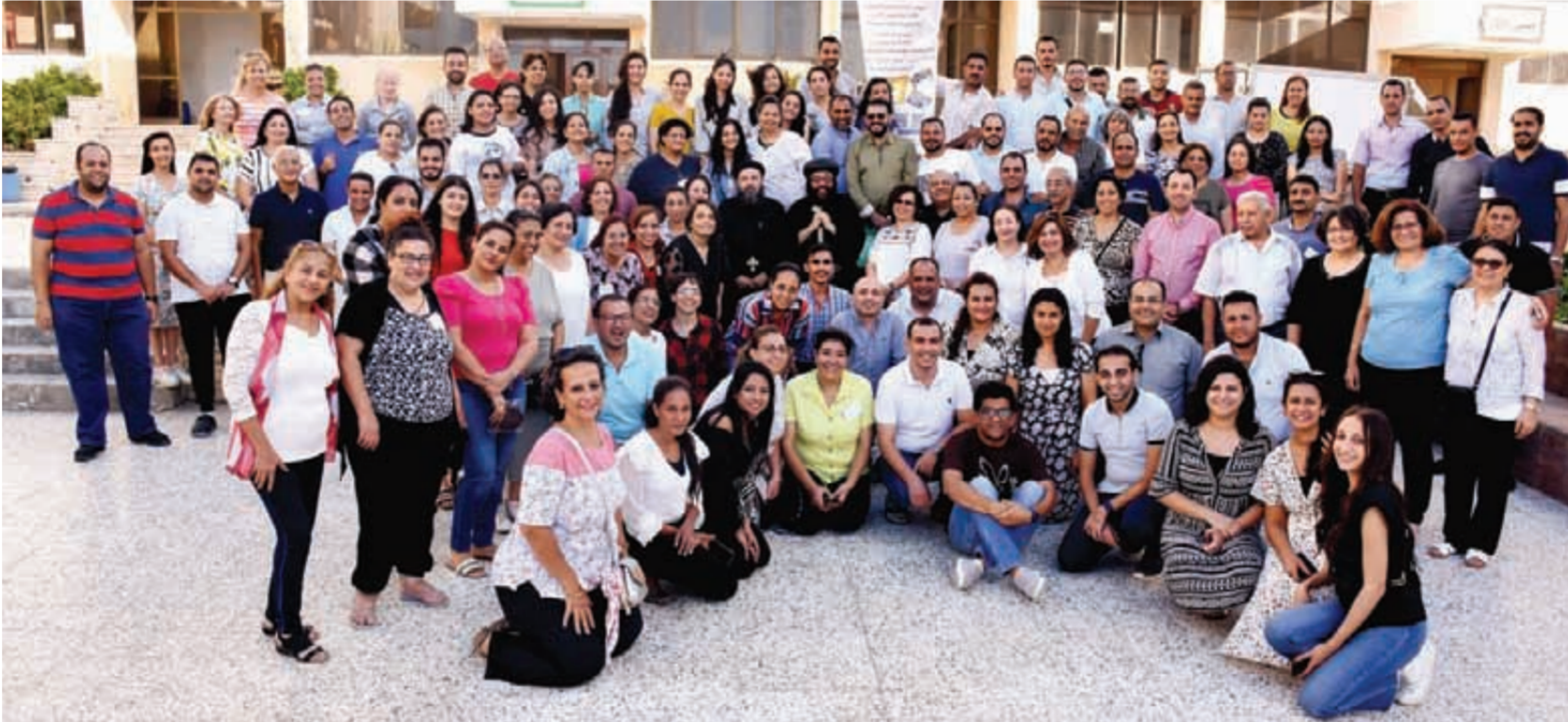
نيافة الأنبا يوليوس وسط كتيبة خدام الأسقفية

«ستون عاما محبة وخدمة.. شعار الاحتفالية إذا أردنا إضافة صفات أخرى مع