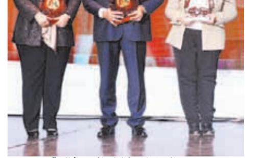
تكريم الوزراء خلال الاحتفالية

وحضر الاحتفالية السادة الوزراء، الكهنة، نيافة القضاة ووزير التضامن الاجتماعي، والوزراء، هشام أمية وزير التنمية المحلية، والسفيرة سها جندى وزيرة الدولة للهجرة وشئون المصريين بالخارج، والمهندس الحالى هاني عازر، ونواب من البرلمان ومجلس الشيوخ الحاليين والسابقين وممثلو الأزهر الشريف ووزارة الأوقاف، وعدد من الوزراء السابقين والعديد من الشخصيات العامة.