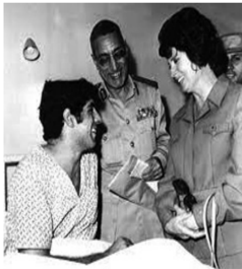
السيدة جيهان السادات تتفقد الجرحى والمصابين