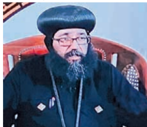
الأنبا يوليوس: الحب لغة يفهمها الجميع والأسقفية تقدم الحب لكل

بذرة حب تنمو فى هدوء» ورحب قداسته البابا تواضروس فى كلمته بالحضور مشيراً أننا فى يوم تاريخي، حيث تمت سيامة نيافة الأنبا صموئيل أسقفًا للخدمات العامة والاجتماعية والمسكونية، ونيافة الأنبا شنودة أسقفًا للسهام اللاهوتية والكهنة الكاثوليك والتربية، بيد قداسته البابا كيرلس السادس ثم تحدث عن أن المتنيح الأنبا صموئيل عمل بكل هدوء ومعهم أفراد قليلين، مثل البذرة التي تنمو فى هدوء، فون صبيح وبدأ عمل الأسقفية بنسج بالتدريج، وتولاهم بعد الأنبا صموئيل، وأربعة من الآباء، الأساقفة الأجراء الذين عملوا فيها بنفس الروح ونفس الأمانة.