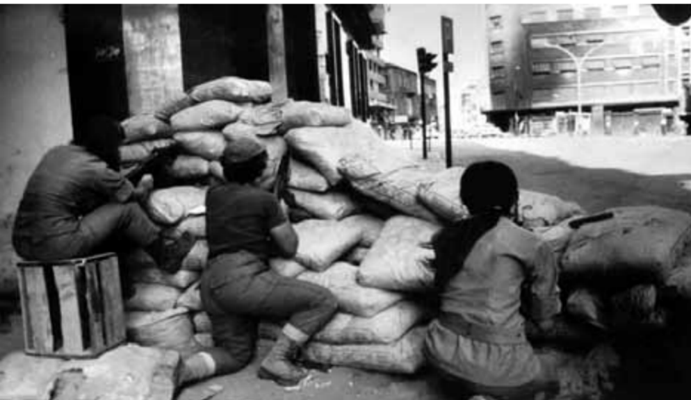
إحدى الكتائب النسائية