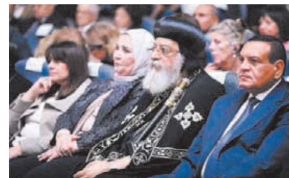
البابا تواضروس يتوسط السادة الوزراء