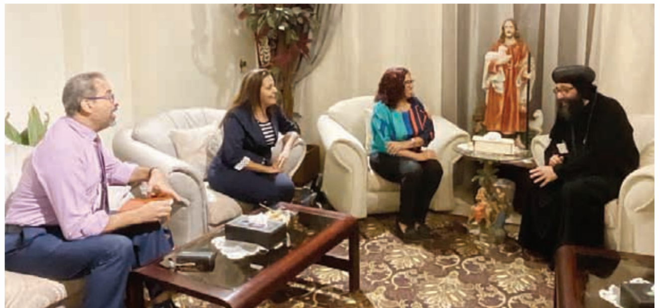
« وطينى » تحاور نيافة الأنبا يوليوس