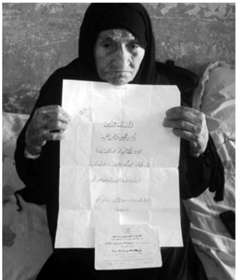
فرحانة سلامة أشهر مجاهدات سيناء

« الله معك ونحن خلفك والنصر حليفك إن شاء الله ».. برقيات تأييد أرسلتها سيدات الهلال الأحمر للرئيس السادات « الأندية الرياضية.. خلية لتدريب الفتيات على التمريض والإسعافات وضرب النار » « أول كتيبة نسائية تكونت على يد درية شفيق وتألفت من ٦٠ متطوعة »