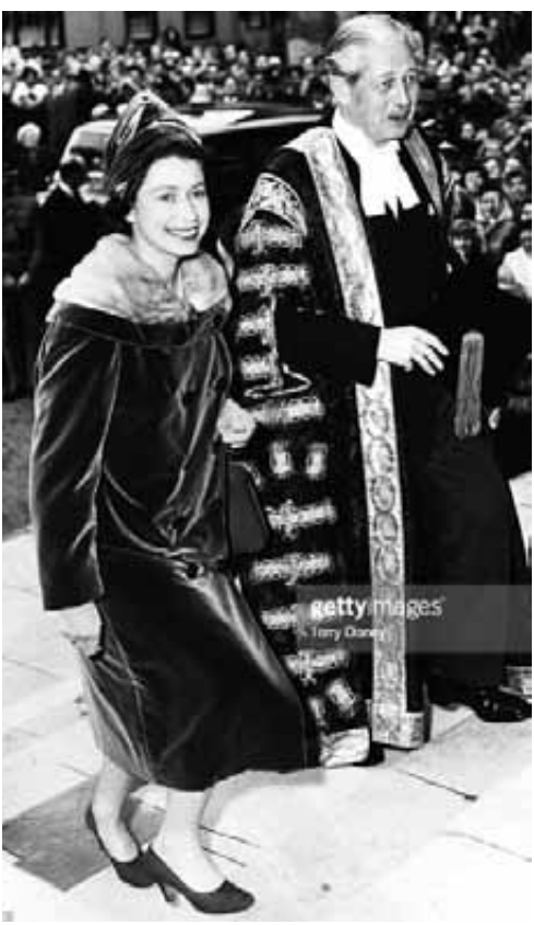
الملكة تزور هارولد ماركيميلان رئيس الوزراء ومستشار جامعة أكسفورد في مقر الجامعة

أصبح بعد ذلك وزيراً للبحرية، وفي بداية الحرب العالمية الأولى تعرضت البحرية البريطانية لإخفاقات شديدة وأجبر تشرشل على الاستقالة. ثم انضم لحزب المحافظين وعين وزيراً للخارجية، فأعاد العمل بميول اليميني أتحديد قيمة الجنيه كيمية معينة من الذهب فأدى ذلك إلى انهيار الطلب في أسواق التصدير.