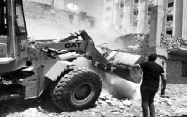
إزالة التعديلات بنطاق حى الأربعين بالسويس

السويس: رافت إدوار تكثف محافظة السويس الجهود المبذولة لإزالة التعديلات على أراضى أسماك الدولة ضمن الموجة ال-٢٠، والتي تستمر حتى ٢٧ أكتوبر الجارى على مستوى محافظة السويس الخمسة «الأربعين - فيصل - السويس - عتاقة - الجنان» لاسترداد حق الدولة وفرض سيادة القانون من خلال توجيهات اللواء أركان عبد الحاميد صفر محافظ السويس.