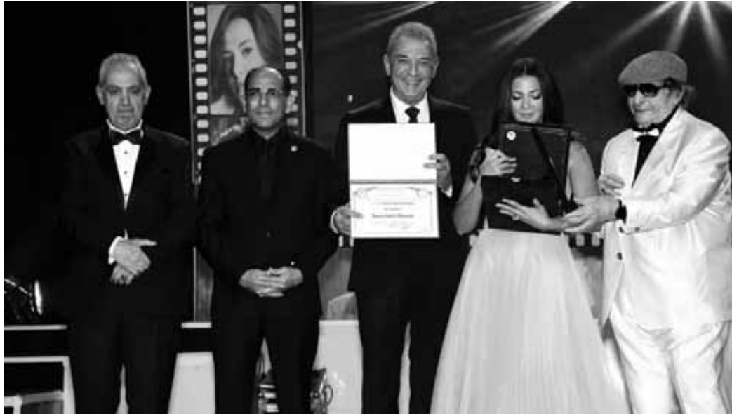
رئيس المهرجان يكرم الفنانة دنيا سمير غانم وسط كوكبة من صناعات السينما