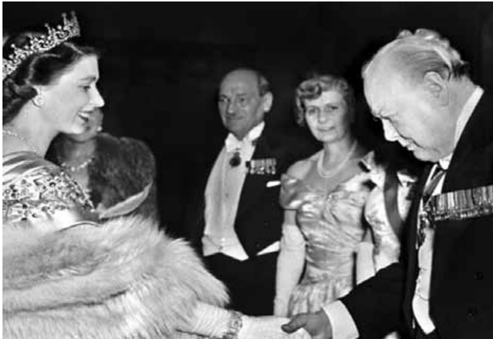
الملكة الزائبة تصافح ونستون تشرشل

في العامين الأخيرين من حكمه في الفترة الثانية أي من (١٩٧٤ - ١٩٧٦) تركّز جوهده على الإصلاح الداخلية، واتخذت إجراءات لتوقف العنصرى ضد الائتلاف، أما سياساته الخارجية فلم تنسم بالتحديد، فكل ما كان يصور إليه هو الحفاظ على دول الكومنولث وتغذية التحالف الاقتصادي الأمريكي، والدليل على ذلك مشاركة بريطانيا في حرب فيتنام، ونتيجة ذلك تعرضت بريطانيا لأزمة مالية شديدة، حيث واجهت الحكومة عجزاً في ميزان المدفوعات. فانس ويلسون قسم الشؤون الاقتصادية ليقوم بتطبيق خطة قومية طموحة.