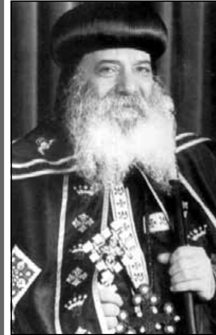
بقلم مثالث الرحمت طيب الذكر المتبحر: الابا شنودة الثالث

أحب أن يكون موضوع تأملاتنا اليوم هو قول الكتاب «صوت حبيبي.. هوذا آت، طافراً على الجبال، قافراً على الخلال، (نش ٢: ٨)» وأذكر أنني لقيت محاضرة من قبل حول عبارة «صوت حبيبي» لذلك نبدأ اليوم بعبارة: «هوذا آت».