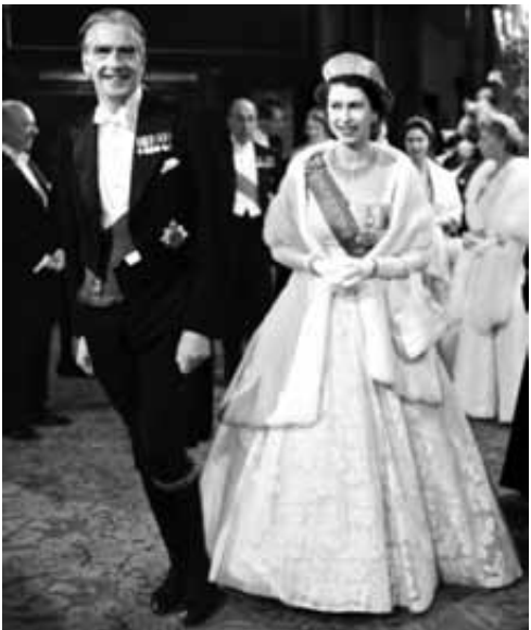
الملكة مع انطوني إين

ولكن الشعب قاوم ببسالة. وصدر قرار من الأمم المتحدة بوقف إطلاق النار.