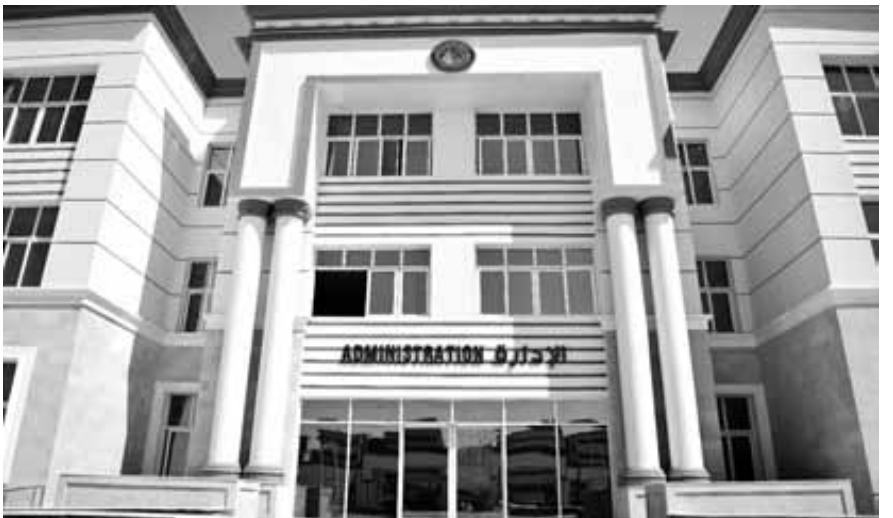
الجامعة الأهلية ببنى سويف

بنى سويف: جريس وهيب وسط فرحة الطلاب والطالبات، استقبلت الجامعة الأهلية ببنى سويف للعام الدراسي الأول لها في ١٥ برنامجا في ١١ كلية. وأكد الدكتور محمد هانى غنيم محافظ بنى سويف أن الجامعة الأهلية على أرض المحافظة صرح تعليمي أصيف لجامعة بنى سويف، فهي تحاكي أحدث نظم التعليم وتوفر العديد من البرامج الدراسية في مجالات مختلفة بمصروفات سنوية أقل من الجامعات الخاصة فضلاً عن أن الحد الأدنى للقبول بلكيات الأهلية أقل من نظيرتها الحكومية. مشيدا بجهود رئيس الجامعة التي مازالت تسفر عن خطوات نوعية تضاعف من الميزات النسبية لوارد ومقومات المحافظة خاصة في قطاع التعليم العالي والتوسع في الدور المجتمعي للجامعة. وأضاف المحافظ أن إنشاء الجامعة الأهلية يعتبر من أهم المشروعات القومية التي تأتي بالتوازي والتكامل مع مشروعات قومية أخرى في قطاعات حيوية، وهو ما يعكس توجه الدولة تحت قيادة فخامة الرئيس السيسي نحو تنمية شاملة ومستدامة في كافة القطاعات، معرباً عن سعادهتة بأن تكون بنى سويف من المحافظات التي حظيت بتلك الفرصة المميزة التي ستضاف إلى ميزاتها النسبية في العديد من المجالات، وإلى أهمية المشروع على الصعيد العلمي بإتاحة تخصصات علمية توابك التطور وتلبي احتياجات سوق العمل.