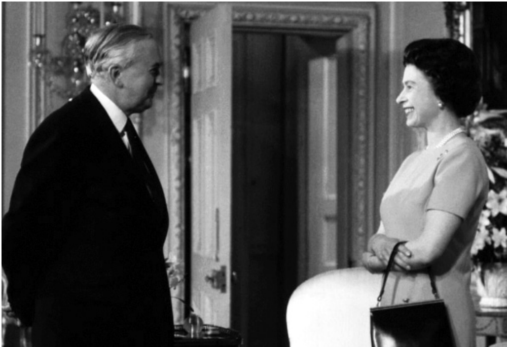
هارولد ويلسون والملكة الزائبة

وتزوج من ابنته عام ١٩٢٠، وعندما عاد إلى لندن انضم إلى شركة النشر العائلية ماركيميلان للنشر كصغير وظل مع الشركة إلى أن تم تعيينه كسكرتير برلاني لوزير التموين (١٩٤٠ - ١٩٤٢)، كانت مهمته في توفير الأسلحة والمعدات الأخرى للجيش البريطاني وسلاح الجو الملكي.