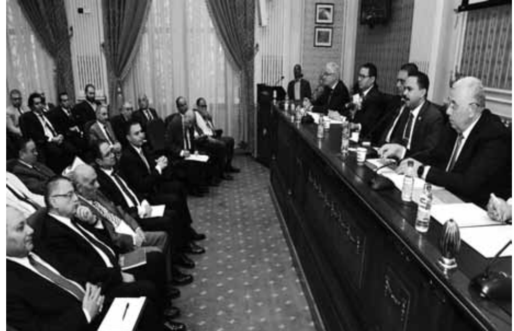
اجتماع لجنة الزراعة بالنواب بوزير الزراعة

تمثل الثروة الداجنة في مصر أهمية كبيرة في السوق المصرية والقطاع الاقتصادي، حيث تنتج مصر ١.٥ مليار دجاجة كل عام، و١٣ مليار بيضة سنوياً حسب تصريحات رئيس اتحاد منتجي الدواجن، ولكن أيضاً من حيث عدد قطاع العمالة في هذا المجال الذي يضم أكثر من ٤ ملايين عامل. وتمثل الثروة الداجنة القطاع الأهم لإسباماً للطبقات المحدودة، التي كانت تعتمد في استهلاكها على الدواجن في ظل ارتفاع أسعار اللحوم الحمراء وعدم كفاية الإنتاج المحلي للسوق، والاتجاه للاستيراد لسد العجز، لإسباماً في ظل الأزمة الاقتصادية العالمية التي يعاني منها العالم وأدت لارتفاع كبير في الأسعار في كافة السلع، لإسباماً منذ بدء الحرب الروسية- الأوكرانية، وخاصة أن النصيب الأكبر من استيراد الحبوب ومنها الذرة التي تدخل في صناعة الأعلاف من هاتين الدولتين، وهو ما أثر بشكل كبير على عملية الاستيراد، فضلاً على ارتفاع قيمة الدولار أمام الجنية المصري، ووجود أزمة في توفير العملة الصعبة، في أزمة ظهرت بوادرها مؤخراً.