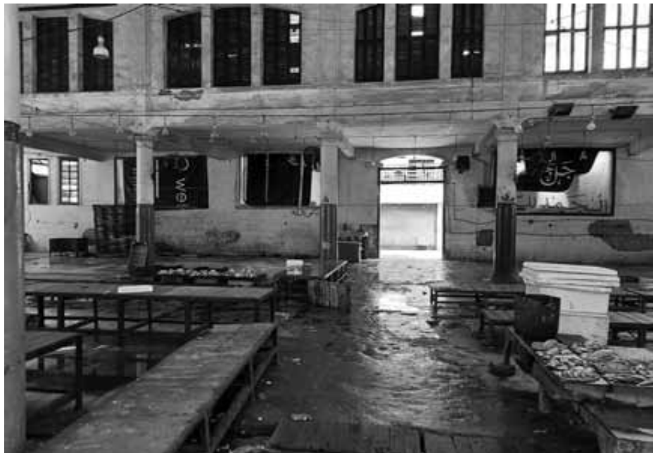
حلقة السمك بالإسكندرية

ساحل البحر المتوسط وكذلك حركة مراكب الصيد، حيث تم إنشاء الحلقة عام ١٨٢٤م، وتضم مبنى أثريا مطلا على شارع قصر رأس التين، وهو منشأ منذ أكثر من مائة عام، يتم ترميمه، ومبنى ملحق يضم لتطوير حاليا. قال اللواء محمد الشريف محافظ الإسكندرية إن تطوير حلقة السمك يأتي انطلاقاً من كونها أهم سوق تجارية للأسماك في نطاق الوجه البحري، ويساهم في إطار خطة المحافظة لتطوير وإنشاء حلقة السمك على أعلى مستوى يليق بسرمول البحر الأبيض المتوسط وفي ضوء توجيهات الدولة لبيع الجملة والتجزئة وتلاجا تخزين الأسماك، وتفوير أماكن إدارية لمتابعة إدارة الحلقة والمطاعم والحللات، وكذلك توفير جراحات تخدم المواطنين