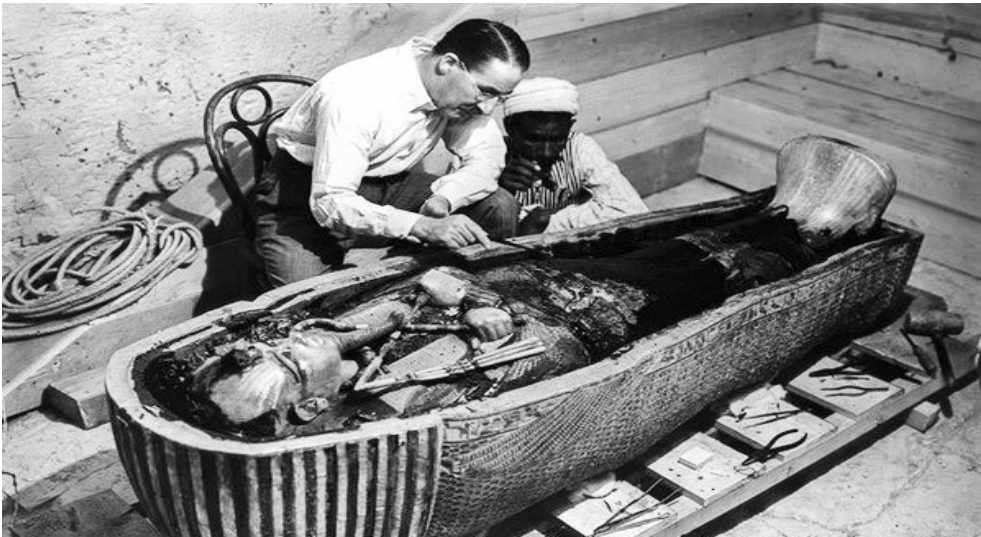
Photo archive de l'inspection du sarcophage de Toutankhamon

Le ministère du Tourisme et des Antiquités poursuit le lancement d'une campagne sur ses réseaux sociaux sous le thème «Cent ans de Toutankhamon: des antiquités merveilles», pour commémorer le centenaire de l'une des plus importantes et plus admirables découvertes archéologiques au monde. La campagne a pour objet d'informer le public de certaines pièces antiques distinguées qui ont été mises au jour dans la tombe de Toutankhamon, afin d'améliorer la sensibilisation touristique et archéologique des citoyens et de porter à leur connaissance l'importance de cette grande découverte qui a eu lieu le 4 novembre 1922 grâce à l'archéologue britannique Howard Carter. A l'époque, les découvertes mises au jour dans la tombe de Toutankhamon ont été transportées au musée du Caire à Tahrir et sont en cours d'être transportées vers le Grand musée égyptien où elles seront exposées au complet et d'une façon permanente.