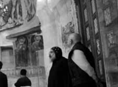
وفود سياحية في زيارة لإحدى نقاط مسار العائلة المقدسة

كنيسة العليقة مازالت موجودة حتى الآن داخل دير سانت كاترين، وفي القرن السادس الميلادي تم بناه، دير طور سينا، وتحول إلى دير سانت كاترين في القرن التاسع الميلادي بعد العثور على رفات القديسة كاترين، وشرح الدكتور عبد الرحيم تفصيل كنائس كنوز دير سانت كاترين. هذه المسارات التاريخية لها تقديرات من البشيرة حول العالم حتى أن اليونسكو سجلت مسار ميمتا عام ١٩٨٢م في إسبانيا باستاجيو دو كامبوسيتيلا، وسانتياغو de santie de postela، وهذا الطريق ميني على قمة القديس ويعتبر أحد تلاميذ القديس يوحنا المعمدان الذي قُتل على رأسه في القدس وحملت الملائكة جسده إلى هذا المكان، وبناءً عليه بنيت كنيسة القديس يوحنا المعمدان ويعتبر من أهم مواقع الحج، ويتم عمل ندوة كبيرة لزيارته ونوال البركة منه، وبذلك مهم جدا