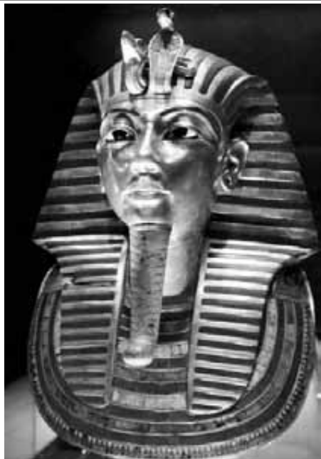
Masque funéraire en or de Toutankhamon