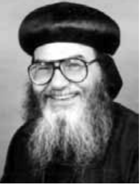
ثبافة الأنبا موسى أسقف الشباب

إن كل ما ذكرناه بخصوص الرسالة الثانية ينطبق على الرسالة الثالثة من حيث: