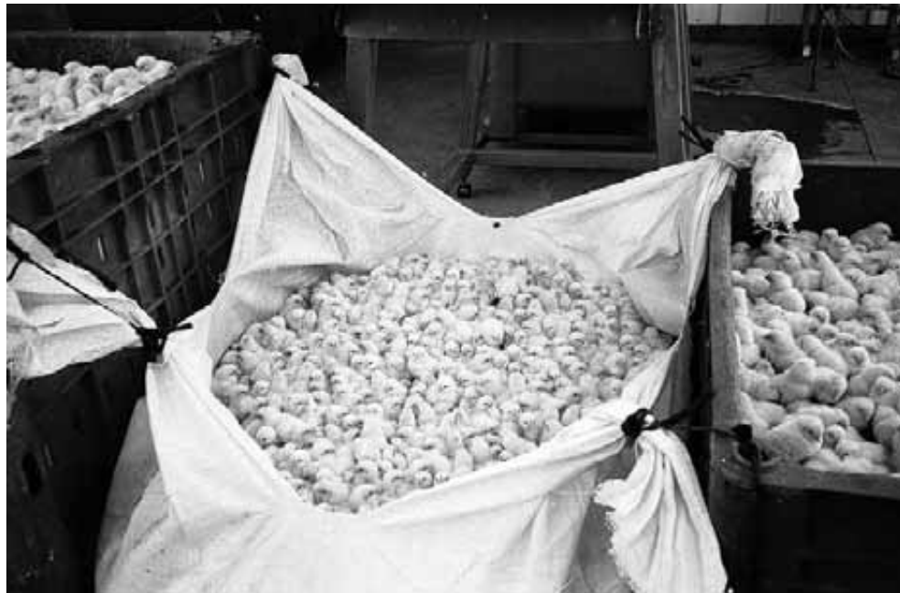
الأعلاف بانتظار الإفراج من الجمارك

وأضاف وزير الزراعة: تم أيضاً توفير تمويل قروض ميسرة بغائدة ٥٪ لدعم صغار المربين لرفع كفاءة مزارعهم وتحويلها من نظام التربية المفتوح إلى نظام التربية المغلقة،