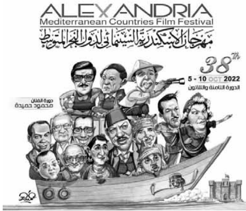
مهرجان الإسكندرية السينمائي الدولي في دورته الـ ٣٨

أعلنت إدارة مهرجان الإسكندرية السينمائي لدول