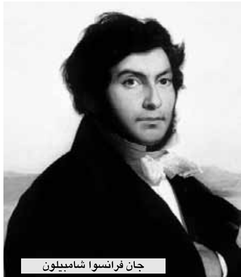
جان فرانسوا شامبليون