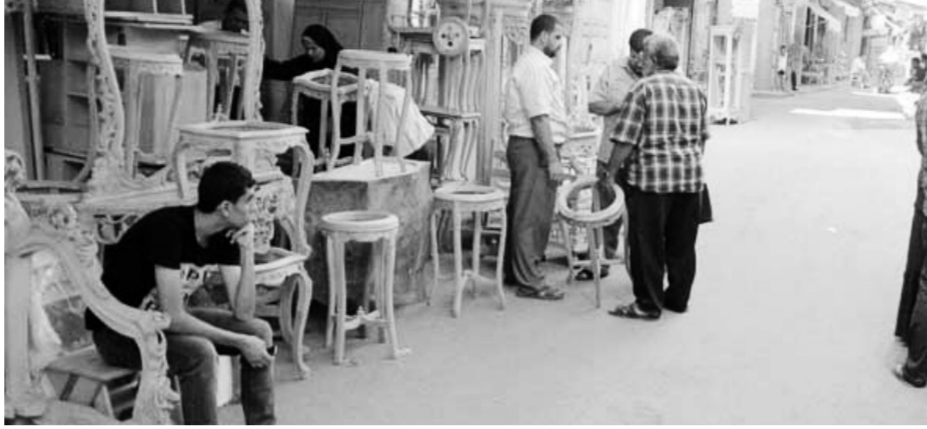
محل أحد صناعات الأثاث

شطا والمناطق الراقية بدمياط خاصة وأنها تتميز بالجودة والإتقان فالشارع أصل صناعة الأثاث، إلا أنه في الفترة الأخيرة ومع حالة ركود الأسعار تراجع حجم المبيعات داخل الورش والمعرض.