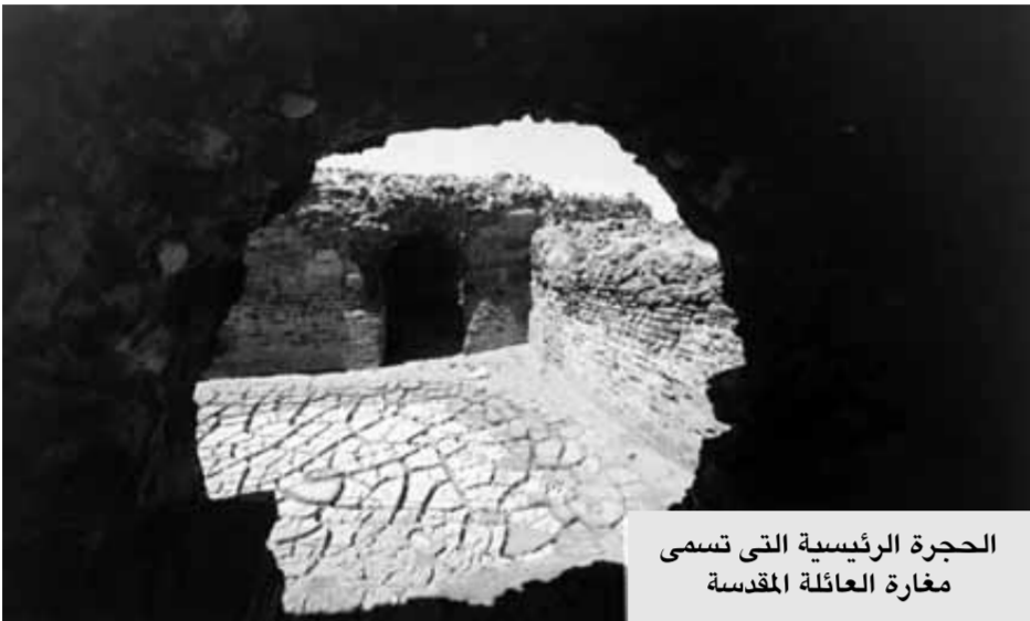
الحجرة الرئيسية التي تسمى مغارة العائلة المقدسة