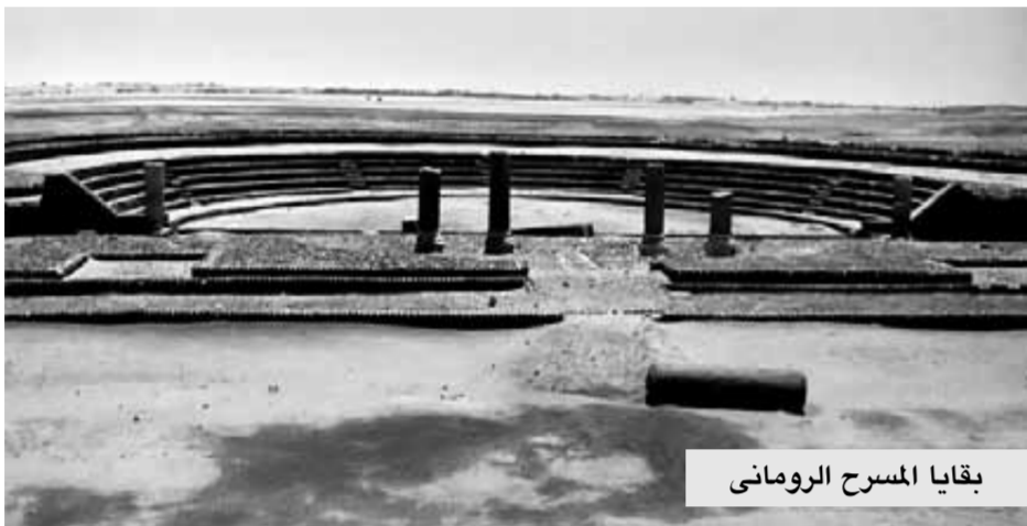
بقايا المسرح الروماني