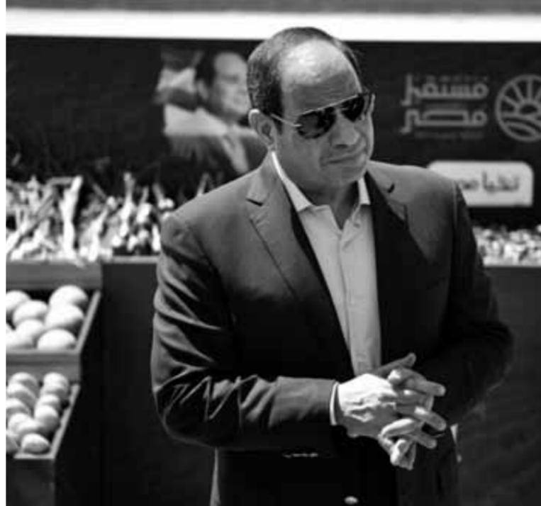
الرئيس عبدالفتاح السيسي خلال تفقده مشروع مستقبل مصر الزراعي

أظهرت الحرب الروسية الأوكرانية تحرك الدولة المصرية في الاتجاه الصحيح من حيث تخطيط وتنفيذ مشروعاتها التنموية القومية الكبرى، وأبرزها مشروع «مستقبل مصر الزراعي»