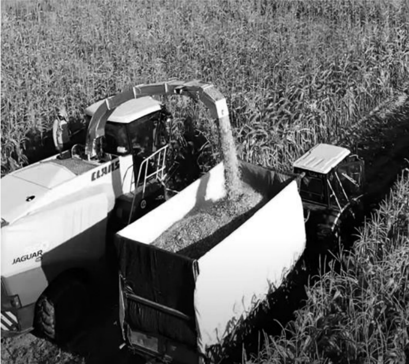
حصاد بأحدث التقنيات