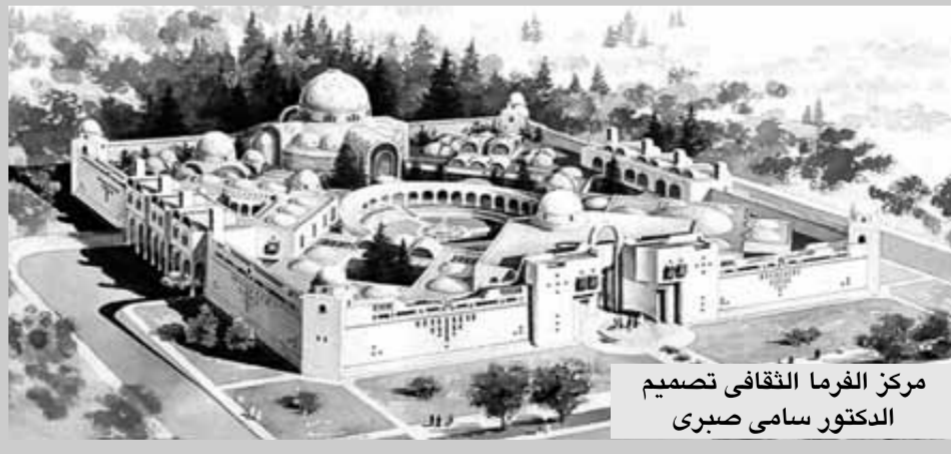
مركز الفرما الثقافي تصميم الدكتور سامي صبرى

الخاص ورجال الأعمال وجمعيات المجتمع المدني،