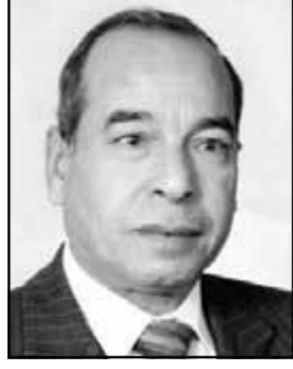
ماجد عطية مفكر وناقد اقتصادى

بالمخارج بلغت خلال شهر مارس الماضى ٣,٢ مليار دولار وفق تقرير البنك المركزى المصرى. وافق مجلس الوزراء على مشروع قانون لإنشاء جهاز لإدارة الأموال المشتركة، بعد الفرص الجديدة لمشاركة القطاع الخاص وزيادة نسبة ملكية فى الوحدات الاقتصادية ونسبة مساهمته فى المشروعات الجديدة المطروحة للاستثمار وفق خطة الدول.