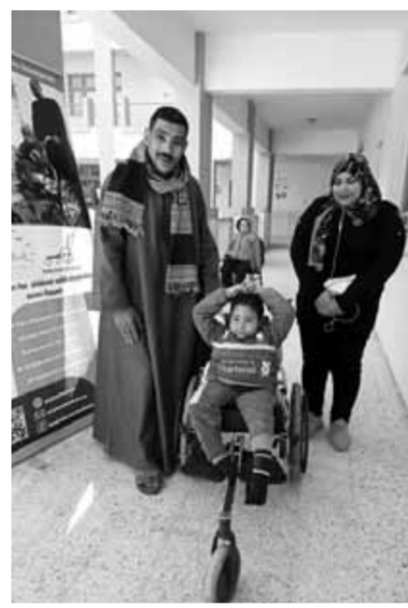
جانب من فعاليات الجمعية

وأضاف أن هذه الوحدات تهدف إلى تحقيق جزء من احتياجات هذه الفئة وإتاحة وسائل مساندة لهؤلاء الأطفال لتوفير قدرة عالية على التنقل ولتخليتهم من العيش والاستقلالية لأنهم من أكثر الفئات المنبوذة والمستعبدة والعزولة أسريًا ومجتمعيًا.