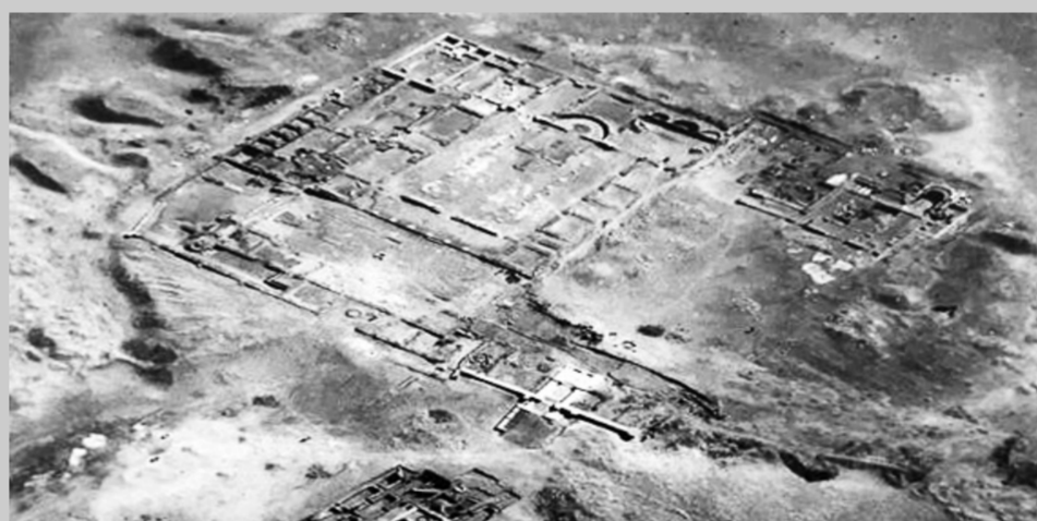
منطقة آثار الفرما