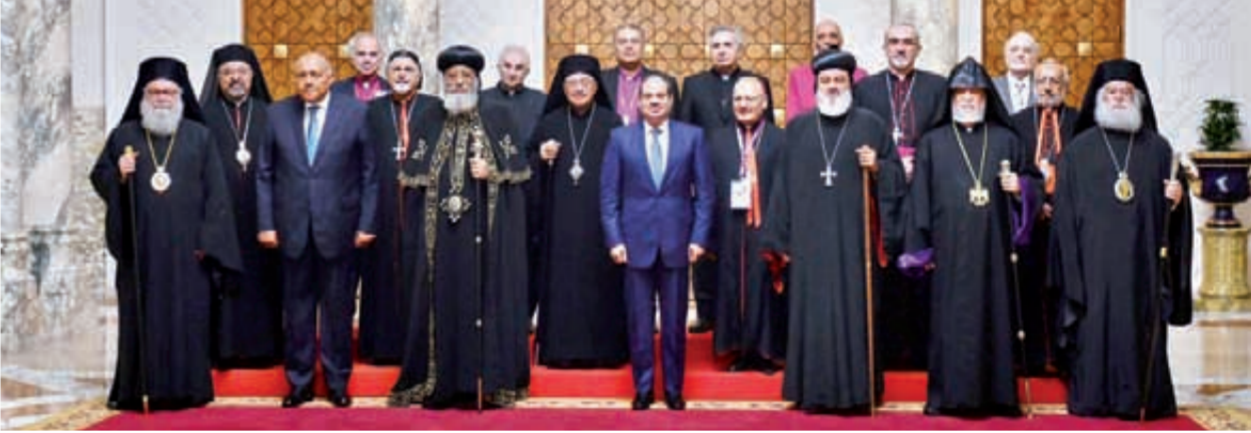
الرئيس عبد الفتاح السيسى يتوسط رؤساء كنائس الشرق الأوسط والكنايس المسيحية الأتوية الزاخرة بالفخرية، فضلاً عن مشروع إحياء مسار العائلة المقدسة وذلك في إطار الانضمام لصفحة ( ٤ ) بحماية التراث المسيحي المصري. فاعلمت الجمعية العامة لمجلس كنائس الشرق الأوسط