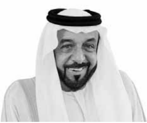
الشيخ خليفة بن زايد آل نهيان

أبو ظبي للتنمية الذي يشرف على برامج المساعدات الخارجية التنمائية لدولة الإمارات. في ٢ نوفمبر عام ٢٠٠٤، توفي والده الشيخ زايد بن سلطان آل نهيان عن عمر يناهز ٨٦ عاماً بعد أن حكم دولة الإمارات لمدة ٢٢ عاماً، فانتخبه المجلس الأعلى للاتحاد وهو أعلى سلطة لصنع القرار في الدولة ويتكهن من حكام الإمارات السبع برئاسة الشيخ مكتوم، في ٢ نوفمبر ٢٠٠٤ عين رئيساً لدولة الإمارات العربية المتحدة بحسب المادة ٥١ من دستور الإمارات التي تنص على «ينتخب المجلس الأعلى للاتحاد من بين أعضائه رئيساً للاتحاد ونائباً لرئيس الاتحاد، ويمارس نائب رئيس الاتحاد جميع اختصاصات الرئيس عند غيابيه لأي سبب من الأسباب».