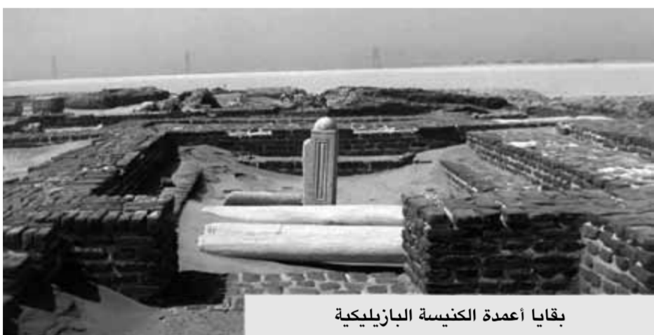
بقايا أعمدة الكنيسة البازيليكية

ارتحلت العائلة المقدسة من بيت لحم إلى غزة، ثم سارت في الطريق الشمالي لشبه جزيرة سيناء، وهو الطريق الساحلي على البحر المتوسط، ويأتي هذا الطريق من رفح ويمتد حتى العريش، ثم حماية الزنانيق عند بداية بحيرة البردويل ثم ينبع ساحل البحر المتوسط حتى يصل إلى الفرما.. بيلويزيوم قديماً.. بين مدينتي العريش وبورسعيد.